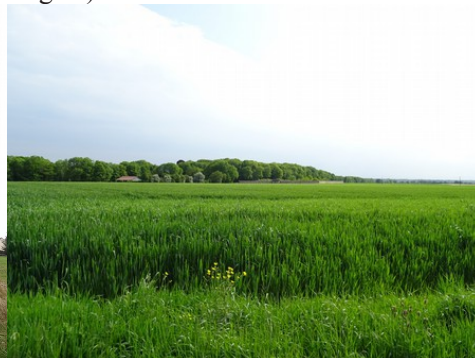
Les champs proches du domaine