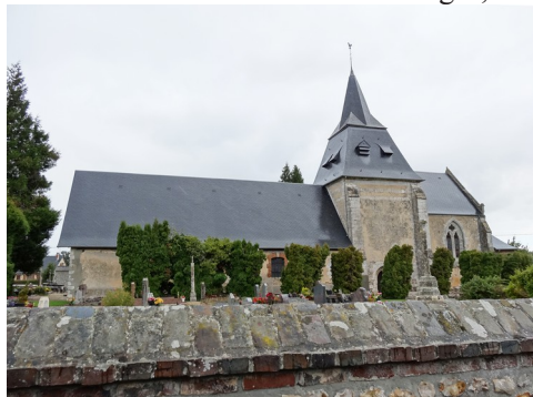
L'église de Bouquelon (inscrite MH)

Les avis seront cohérents avec ceux émis ces derniers années, à savoir : pas de maisons à volume compliqué (type V, W, Y, ou Z), pentes à 45° pour les volumes principaux, ardoise ou tuile plate de teinte brun vieilli, à 20u/m 2 , avec un débord de toiture de 20cm, enduit de teinte beige clair avec modénatures (au choix : chaînages, encadrement de fenêtres, soubassement, colombage...). *Voir les autres fiches.