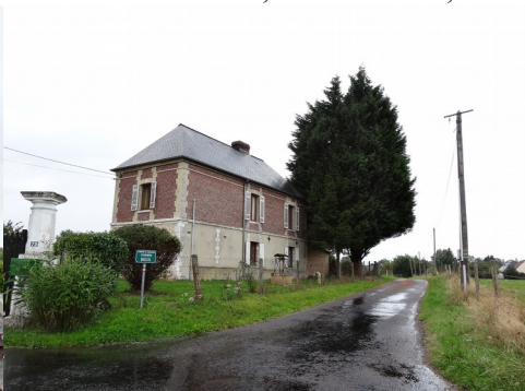
Une demeure avec moellons et briques