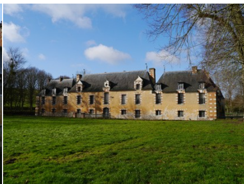
La façade est