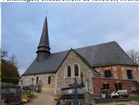
L'église de Bézu la Forêt