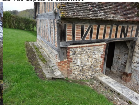
Le porche de l'église (détail de matériaux)