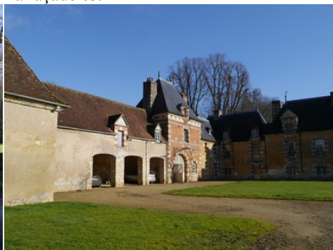
La cour d'honneur