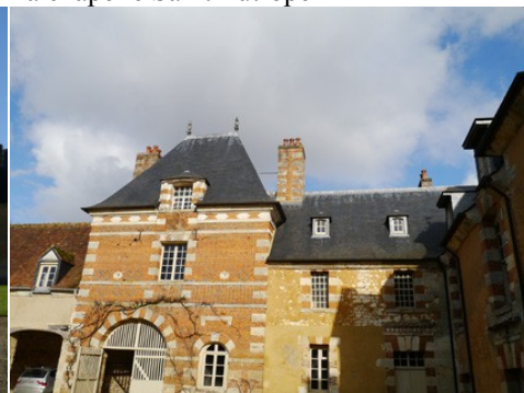
Le pavillon d'entrée

Pour la zone en rose foncé dans le périmètre de 500m