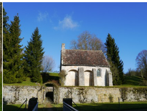
La chapelle Saint Eutrope