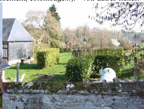
La vue depuis le cimetière