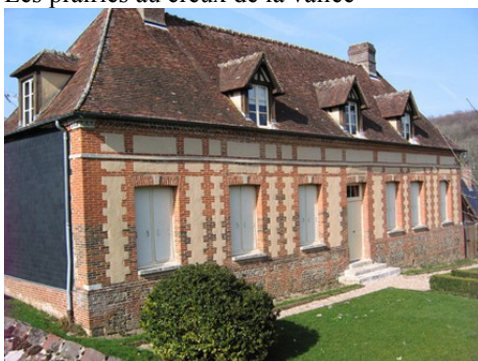
Quelques édifices aux abords