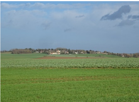
Une vue éloignée du village d'Authevernes

Les avis seront cohérents avec ceux émis ces dernières années, à savoir : pas de maisons à volume compliqué (type V, W, Y, ou Z), pentes à 45° pour les volumes principaux, ardoise ou tuile plate de teinte brun vieilli, à 20u/m 2 , avec un débord de toiture de 20cm, enduit de teinte beige clair avec modénatures (au choix : chaînages, encadrement de fenêtres, soubassement, colombage...). *Voir les autres fiches.