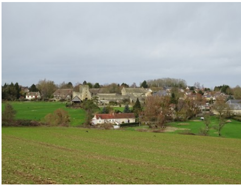
La maison forte vue du Sud