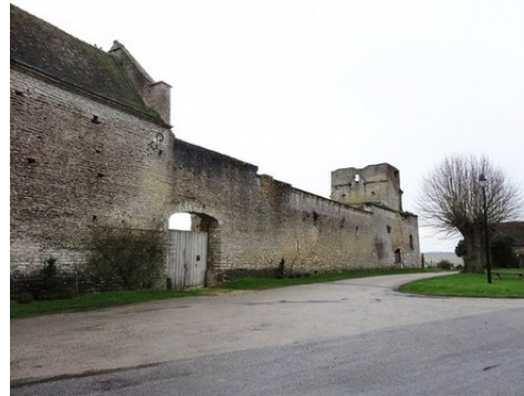
Une vue générale depuis la place