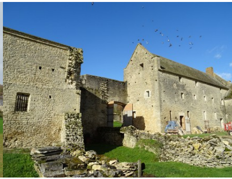
Une vue de la cour