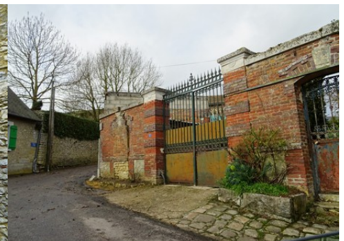
Un portail en briques