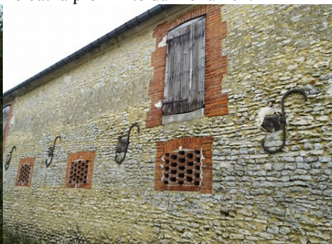
Le détail d'un mur en moellons