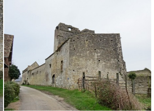
Le logis seigneurial vu du sud-ouest