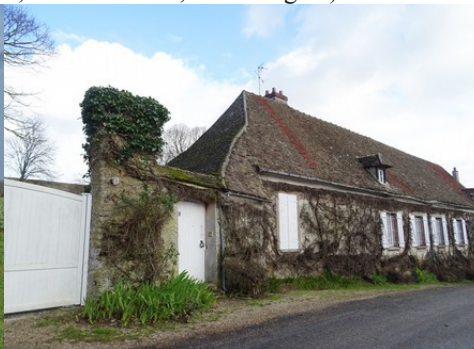
Le bâti à proximité du monument