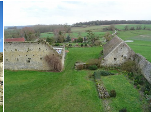
La vue côté Sud-Est de la tour seigneuriale