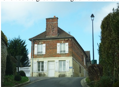
Une maison mêlant briques et moellons