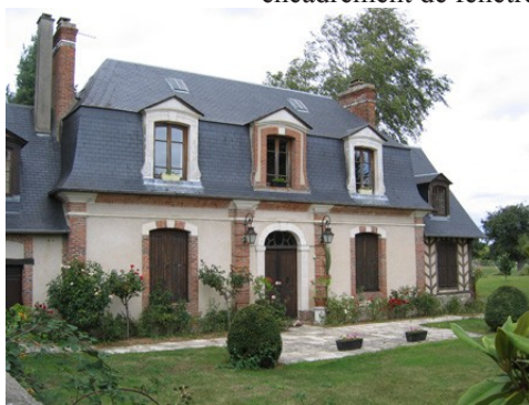
Quelques exemples de maisons alentours

Les avis seront cohérents avec ceux émis ces dernières années, à savoir : pas de maisons à volume compliqué (type V, W, Y, ou Z), pentes à 45° pour les volumes principaux, ardoise ou tuile plate de teinte brun vieilli, à 20u/m², avec un débord de toiture de 20cm, enduit de teinte beige clair avec modénatures (au choix : chaînages, encadrement de fenêtres, soubassement, colombage...). *Voir les autres fiches.