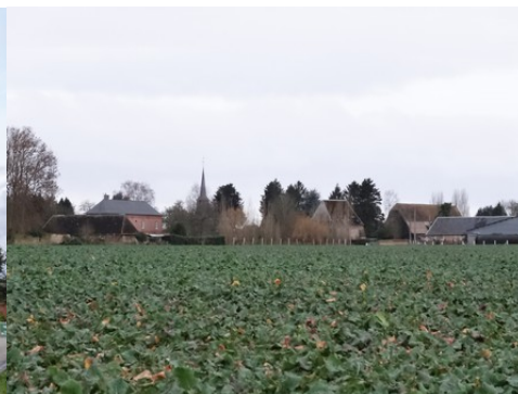
Le clocher et la toiture de la grange sont bien visibles des champs