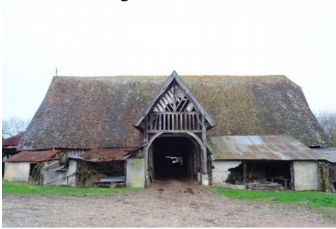
L'ancienne grange dîmière et son porche