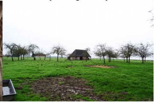
Les vergers et les champs vers le Sud

Pour la zone en rose foncé dans le périmètre de 500m