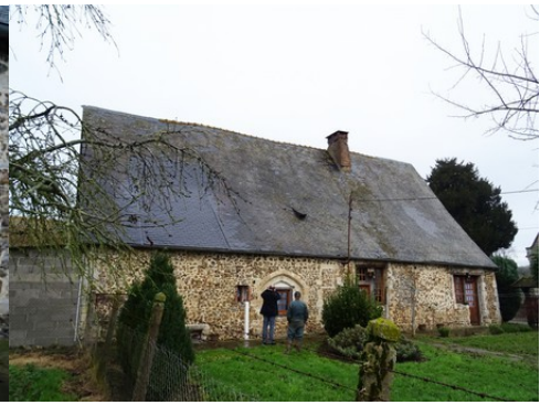
Un ancien corps de logis en dépendance