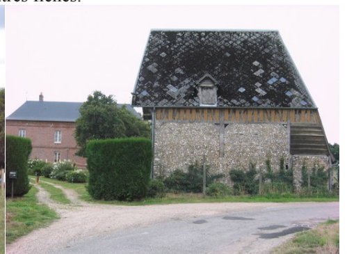
Le bâti rural