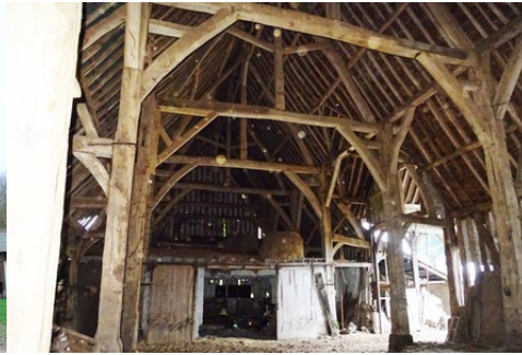
La charpente de la grange