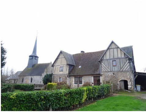
Le manoir et l'église d'Aclou