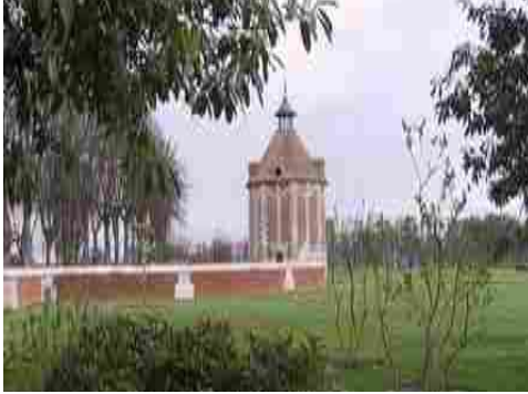
Le colombier (vue lointaine)