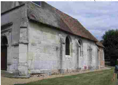
L'église du Troncq (vue rapprochée)

Les avis seront cohérents avec ceux émis ces derniers années, à savoir : pas de maisons à volume compliqué (type V, W, Y, ou Z), Rez-de-chaussée + Combles, pentes à 45° pour les volumes principaux, ardoise ou tuile plate de teinte brun vieilli, à 20u/m 2 , avec un débord de toiture de 20cm, enduit de teinte beige clair avec modénatures (au choix : chaînages, encadrement de fenêtres, soubassement, colombage...). *Voir autres fiches.