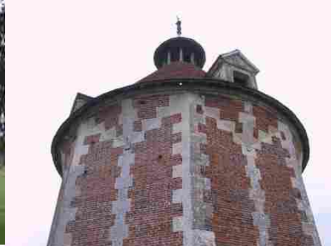
Le colombier (détail de la façade)