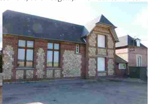
Le bâti rural avoisinant