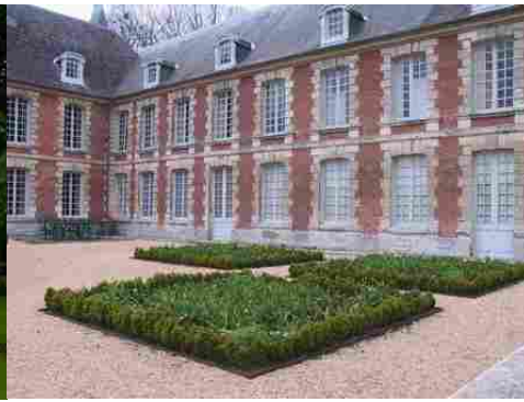
Le château (détail de la façade)