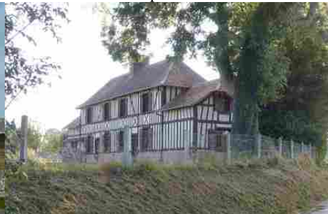
Une maison à pans de bois