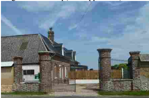
Un portail en briques