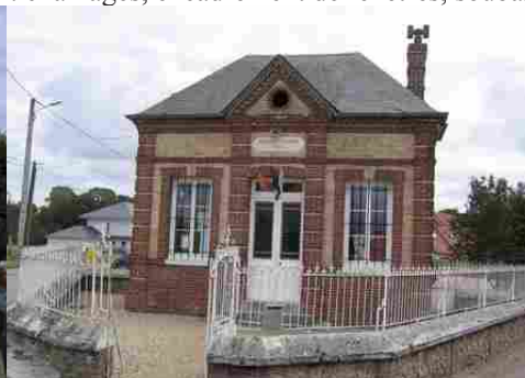
La mairie du Troncq