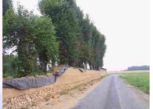
Les travaux sur le mur en bauge du parc

Pour la zone en rose foncé dans le périmètre de 500m