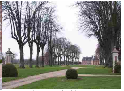
La perspective est sur le château