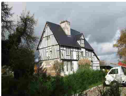
Maison de maître

Ces maisons sont composées d'un soubassement de calcaire et de silex, d'une charpente en colombage à lattes traditionnellement remplie de torchis (mélange d'argile, de paille et de poils d'animaux) et d'une toiture en roseaux progressivement remplacée par de l'ardoise depuis le milieu du 20 ème siècle. La toiture est en queue de geai sur l'une ou sur les deux extrémités de la toiture. Cela permet l'isolation par rapport aux vents dominants. Les fondations de l'habitation sont peu profondes (de 50cm à 1 mètre maximum) car le trou est creusé à la main. Le soubassement également appelé « cafoutin » dans la région constitue une réserve où l'on entrepose fruits et légumes. Sur certaines maisons, on peut observer des ornements en damiers.