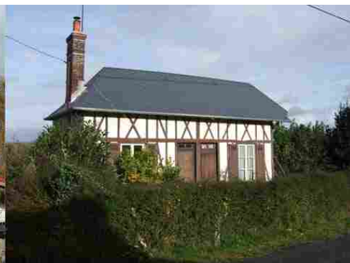
Maison d'ouvrier journalier