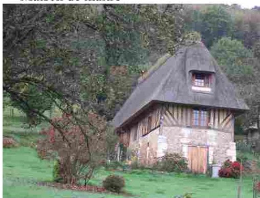
Maison d'exploitant agricole