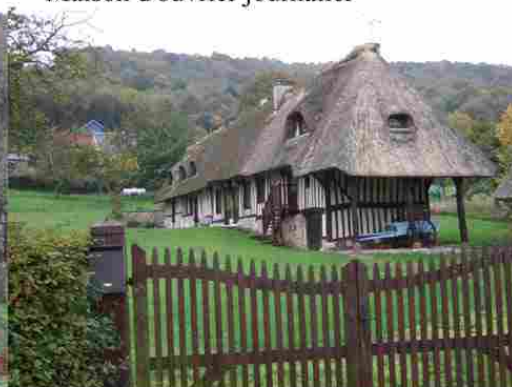
Maison d'exploitant agricole

L'habitation est composée d'une pièce principale comportant le foyer de la maison où les générations se retrouvent. De part et d'autres, chaque génération possède sa pièce qui ne communique pas avec la pièce principale d'où la présence en façade de plusieurs portes. Les ouvertures souvent au nombre de deux par pièce sont petites et plus hautes que larges.