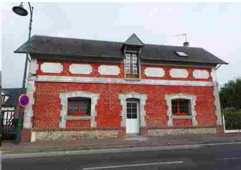
Une maison en briques