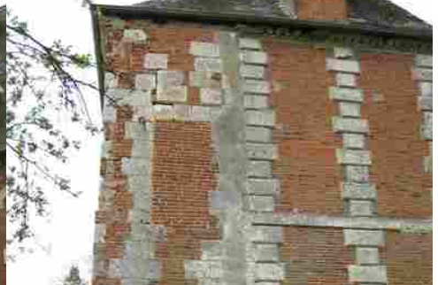
Le pignon est (vue proche)

Pour la zone en rose foncé dans le périmètre de 500m