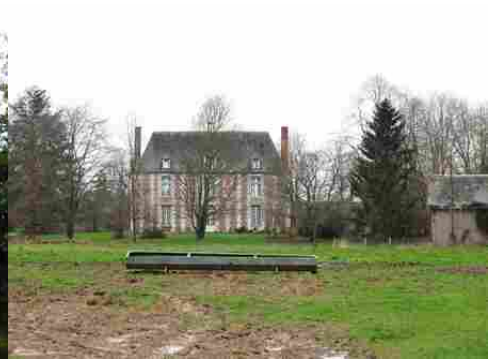
La façade nord (vue éloignée)