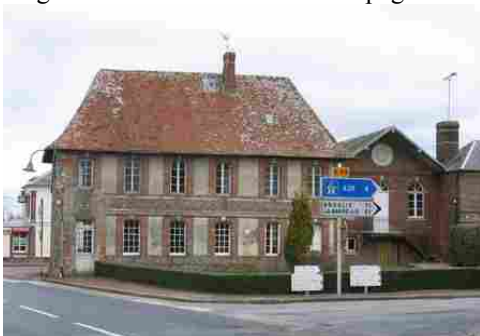
L'emploi de briques, silex et tuiles