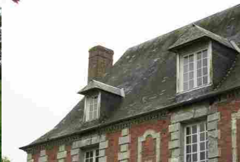
La toiture et ses lucarnes (vue proche)