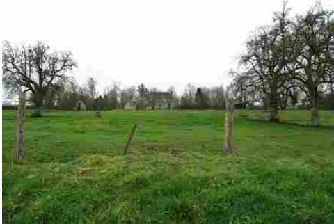
Le manoir dans son environnement