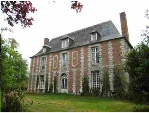
La façade nord (vue proche)