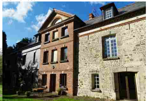
Le manoir du Plessis