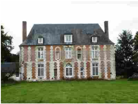
La façade sud (vue proche)