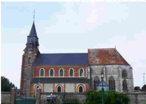
L'église de Saint-Germain la Campagne

Les avis seront cohérents avec ceux émis ces dernières années, à savoir : pas de maisons à volume compliqué (type V, W, Y, ou Z), pentes à 45° pour les volumes principaux, ardoise ou tuile plate de teinte brun vieilli, à 20u/m 2 , avec un débord de toiture de 20cm, enduit de teinte beige clair avec modénatures (au choix : chaînages, encadrement de fenêtres, soubassement, colombage...). *Voir les autres fiches.