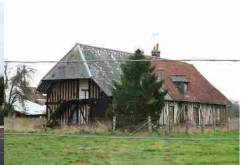
Un exemple d'architecture rurale