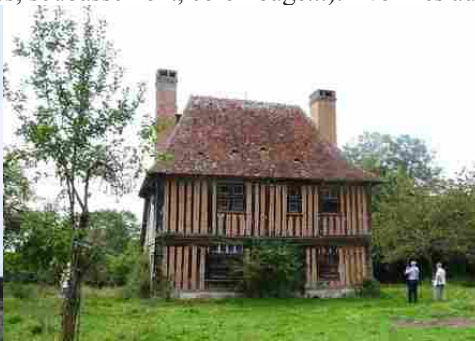
Le manoir du Gal