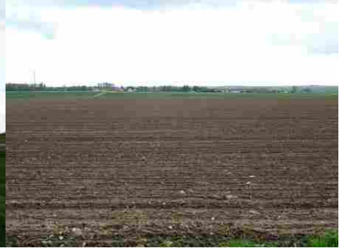
La vue vers le village de Mouflaines