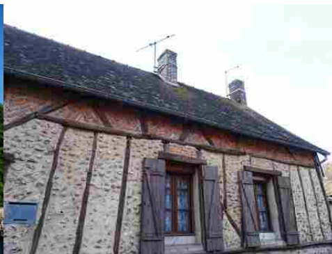
L'usage de pans de bois, moellons, briques