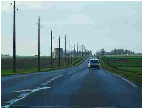
Le moulin vu de la route