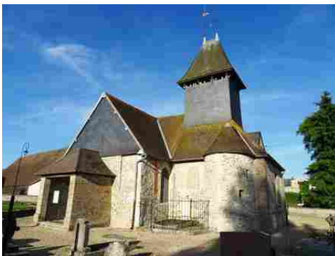
L'église de Mouflaines

Il s'agit d'une zone qui n'a pas vocation à être urbanisée. Seuls des bâtiments annexes au monument historique et/ou dans le strict respect de son style peuvent être envisagés.