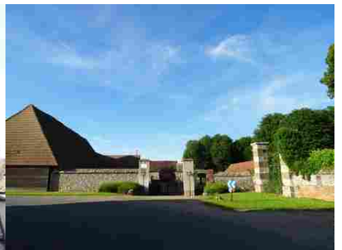
Des portails avec murs de clôture