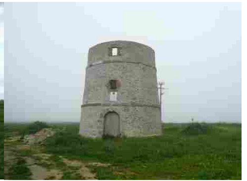
La tour du moulin (vue proche)