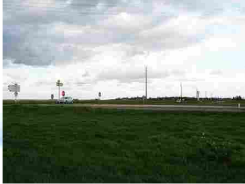
La plaine cultivée environnante