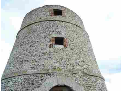
Les maçonneries et les arases restaurées