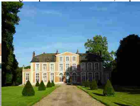
Le château de Mouflaines