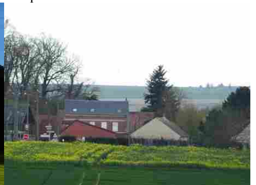
L'entrée de Mouflaines depuis le moulin