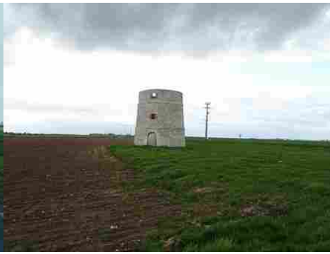
Le moulin et les champs alentours