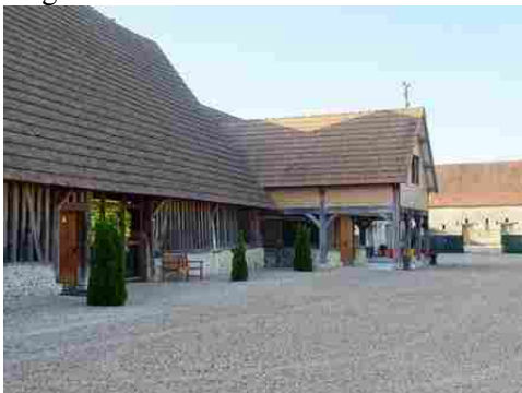
La ferme dite de la Forge