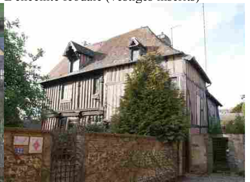
La maison du bailliage (inscrite MH)