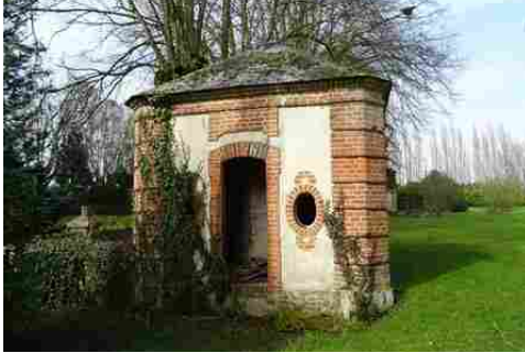
Un pavillon d'angle du parc