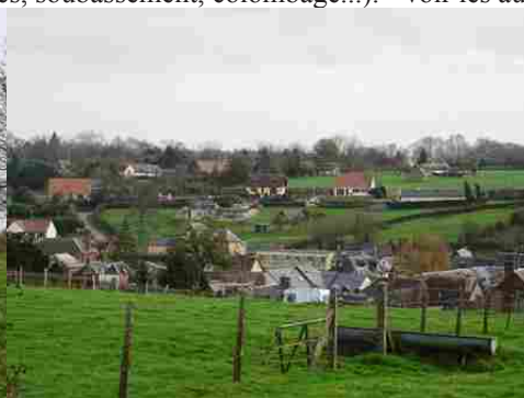
Une vue générale sur la vallée du Guiel