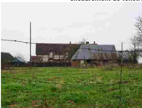
Le bâti rural avoisinant

Les avis seront cohérents avec ceux émis ces dernières années, à savoir : pas de maisons à volume compliqué (type V, W, Y, ou Z), pentes à 45° pour les volumes principaux, ardoise ou tuile plate de teinte brun vieilli, à 20u/m², avec un débord de toiture de 20cm, enduit de teinte beige clair avec modénatures (au choix : chaînages, encadrement de fenêtres, soubassement, colombage...). *Voir les autres fiches.