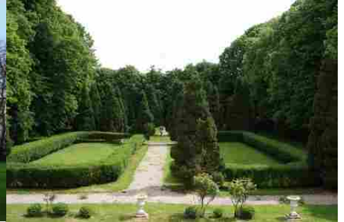
Quelques vues sur le parc vers l'Est