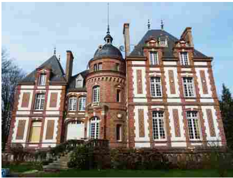
La façade sud et la tourelle d'entrée