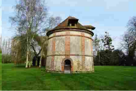
Le colombier circulaire