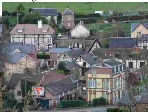
Des maisons en briques ou à pans de bois