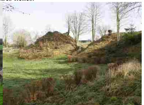
L'enceinte féodale (vestiges inscrits)