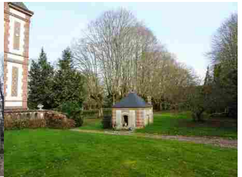
Le pavillon d'angle sud-est et le parc