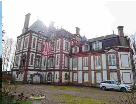
La façade est depuis les jardins