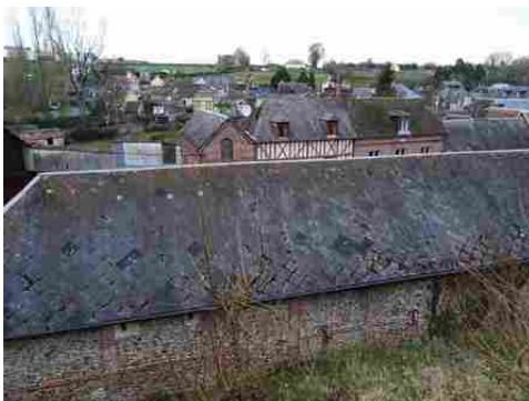
Quelques vue du village de Montreuil