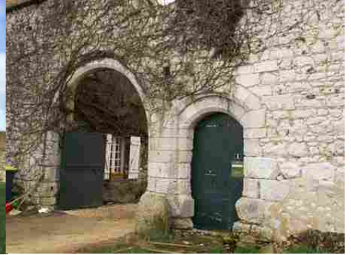
Les vestiges de la porterie