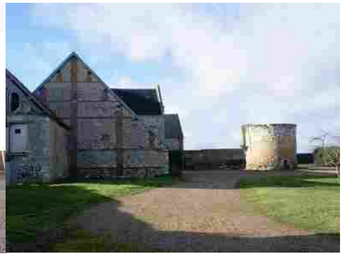
Le pignon de la grange et le colombier