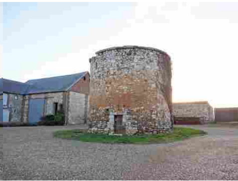
Le colombier circulaire