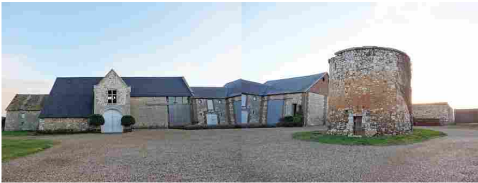
La grange et son porche en pierre