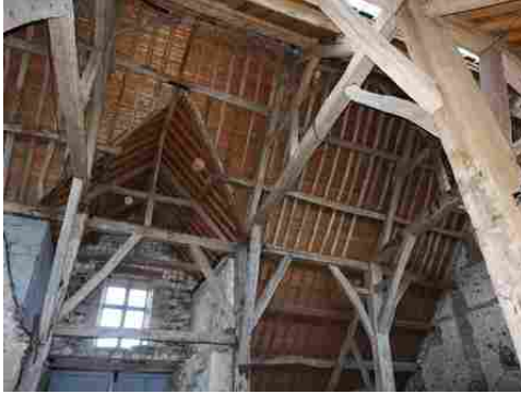
La charpente de la grange