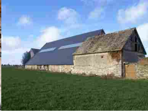
La grange et la clôture depuis le Sud