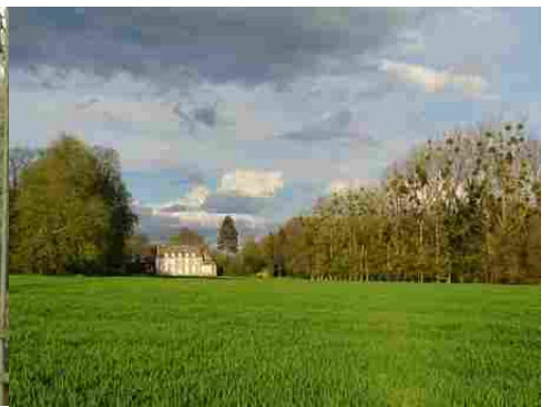
Une vue lointaine du château de l'Ouest