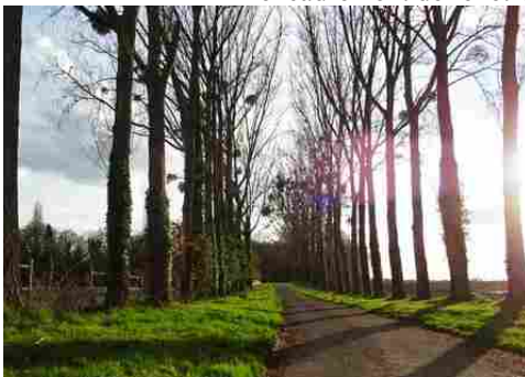
Une route plantée autour du château

Les avis seront cohérents avec ceux émis ces dernières années, à savoir : pas de maisons à volume compliqué (type V, W, Y, ou Z), pentes à 45° pour les volumes principaux, ardoise ou tuile plate de teinte brun vieilli, à 20u/m 2 , avec un débord de toiture de 20cm, enduit de teinte beige clair avec modénatures (au choix : chaînages, encadrement de fenêtres, soubassement, colombage...). *Voir les autres fiches.