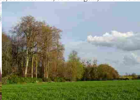
Le paysage de champs et de bois