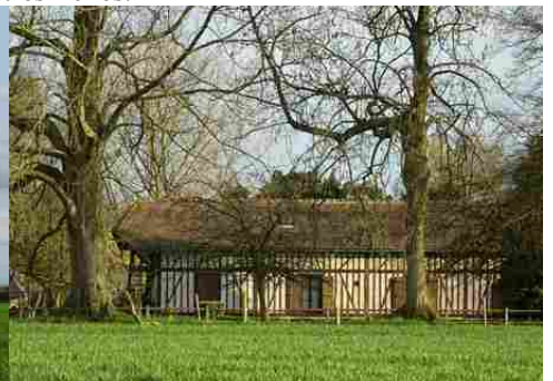
Une maison à pans de bois