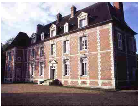
La façade est du château (vue proche)