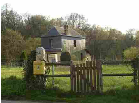
Une maison avec essentage en ardoises