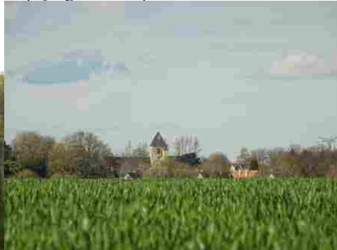
Le village de Bouquetot (vue lointaine)