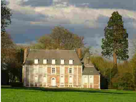
La façade ouest (vue proche)