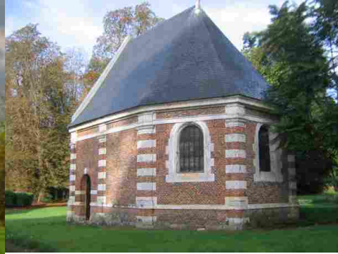
La chapelle du château