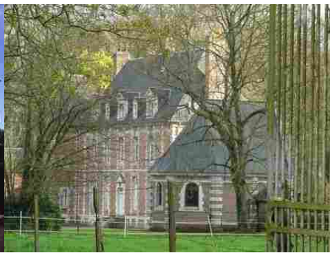
Le château et la chapelle depuis la grille