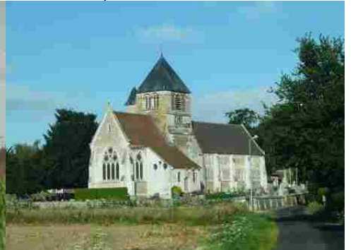
L'église de Bouquetot