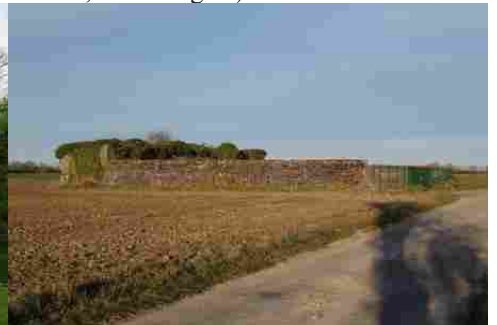
Un vestige de l'aérodrome allemand