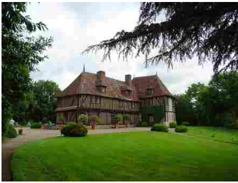
Le manoir (vue éloignée)