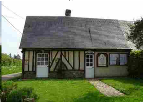
La mairie de Barville en Lieuvin