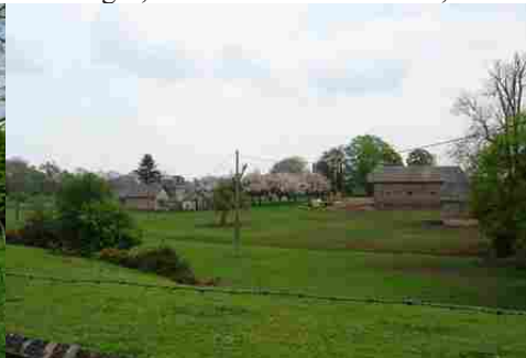
Une ferme et son verger