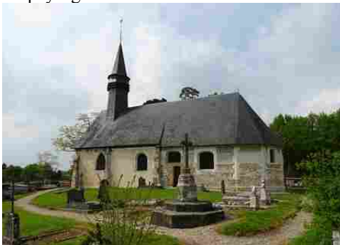
L'église de Barville en Lieuvin