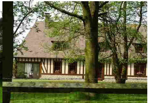
Un exemple d'architecture rurale