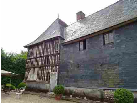
La façade arrière (habillage d'ardoises)