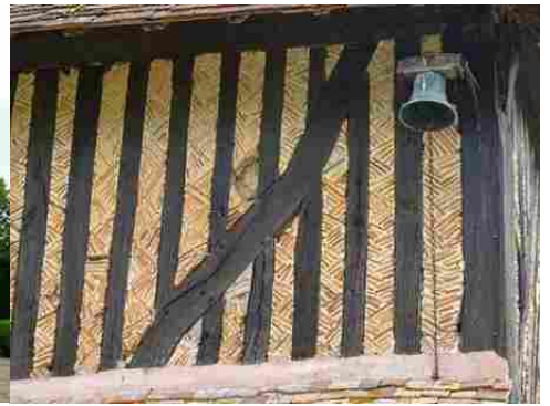
Les matériaux en façade (détail)