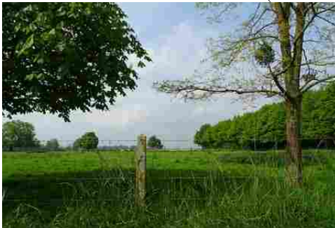
Le paysage alentours

Les avis seront cohérents avec ceux émis ces dernières années, à savoir : pas de maisons à volume compliqué (type V, W, Y, ou Z), Rez-de-chaussée + Combles, pentes à 45° pour les volumes principaux, ardoise ou tuile plate de teinte brun vieilli, à 20u/m 2 , avec un débord de toiture de 20cm, enduit de teinte beige clair avec modénatures (au choix : chaînages, encadrement de fenêtres, soubassement, colombage...). *Voir autres fiches.