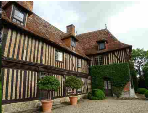
Le manoir (vue rapprochée)