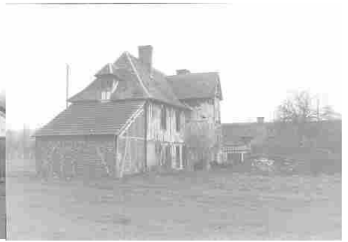
Des vues anciennes du manoir