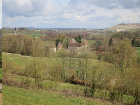
La vue du manoir depuis la côte ouest