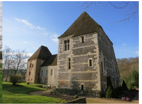
La tour à l'angle nord-est du logis