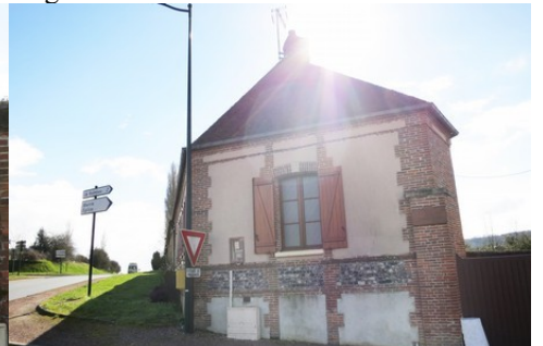
Une façade avec silex, briques et enduit