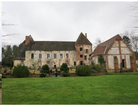
La façade ouest du manoir