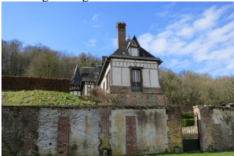
Un mélange de briques et de pans de bois