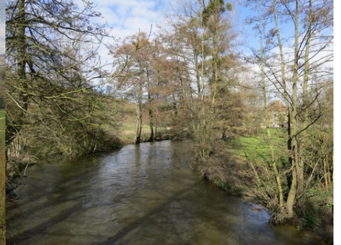
Les berges de l'Epte

Pour la zone en rose foncé dans le périmètre de 500m