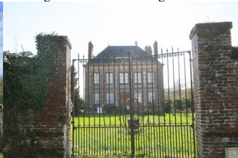
Une ancienne demeure en briques