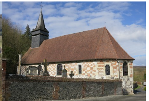
L'église de Bouchevilliers