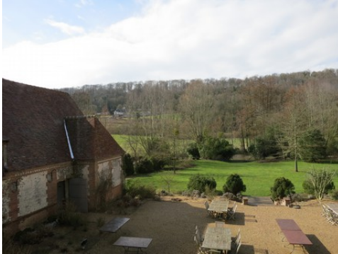
La vue vers les côteaux boisés à l'Ouest