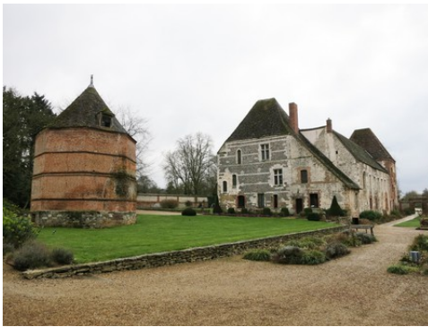
Le colombier octogonal et le manoir