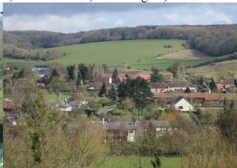
Le village vu de la côte de l'église