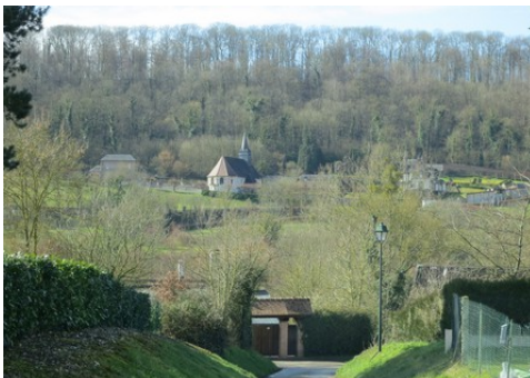
Le village et l'église vus de l'Est

Les avis seront cohérents avec ceux émis ces dernières années, à savoir : pas de maisons à volume compliqué (type V, W, Y, ou Z), pentes à 45° pour les volumes principaux, ardoise ou tuile plate de teinte brun vieilli, à 20u/m 2 , avec un débord de toiture de 20cm, enduit de teinte beige clair avec modénatures (au choix : chaînages, encadrement de fenêtres, soubassement, colombage...). *Voir les autres fiches.