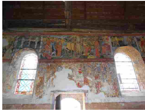
Bezu la Forêt

également à Saint Philibert sur Risle, Appeville-Annebault et quelques panneaux à Muzy) sans que cela ait percolé aux autres églises.