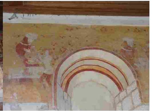
Saint Philibert sur Risle

Notons en passant que les décors du 19 ème siècle, très caractéristiques par leurs couleurs passées (violet foncé, marron, orange moyen, bleu gris..) ne peuvent être lus comme des paramètres communs tant ils ont été utilisés sur tout le département, voire le territoire national dans son ensemble. Il faut écarter ce décor pour rechercher les caractéristiques communes.