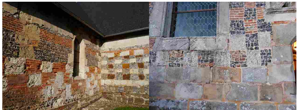
Mesnil sous Vienne

En terme de matériaux, on constate un fort usage des matériaux locaux : moellons, silex, briques... avec l'un des plus usages du damier polychrome de l'Eure pour l'église de Mesnil sous Vienne (grès ferrineux, silex, brique, calcaire...). Mais ce polychromisme ne s'est pas étendu aux autres églises de la vallée.