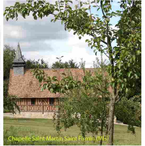
Chapelle Saint Martin Saint Firmin (MH)