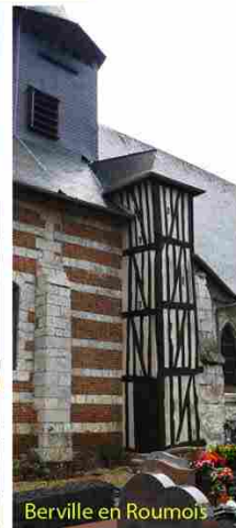
Berville en Roumois