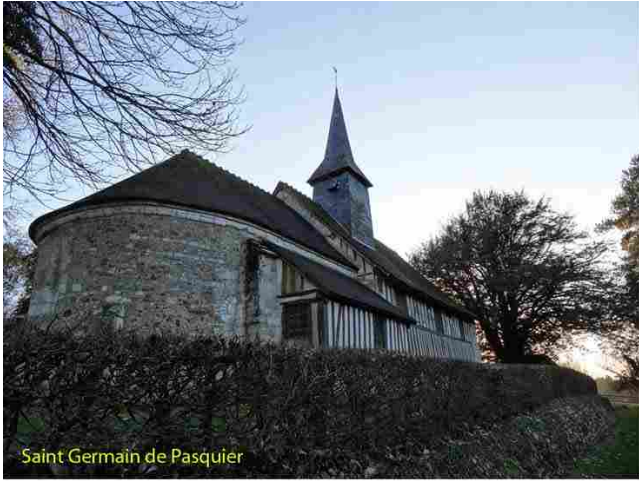
Saint Germain de Pasquier