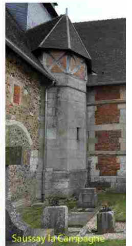
Saussay la Campagne