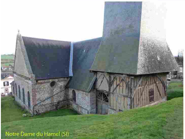
Notre Dame du Hamel (SI)