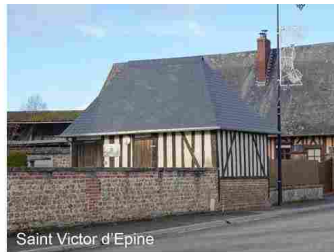
Saint Victor d'Epine