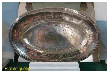
Plat de quête

· Troncs et plats de quête : ils permettaient de recevoir des dons en espèces lors des messes ou des cérémonies.