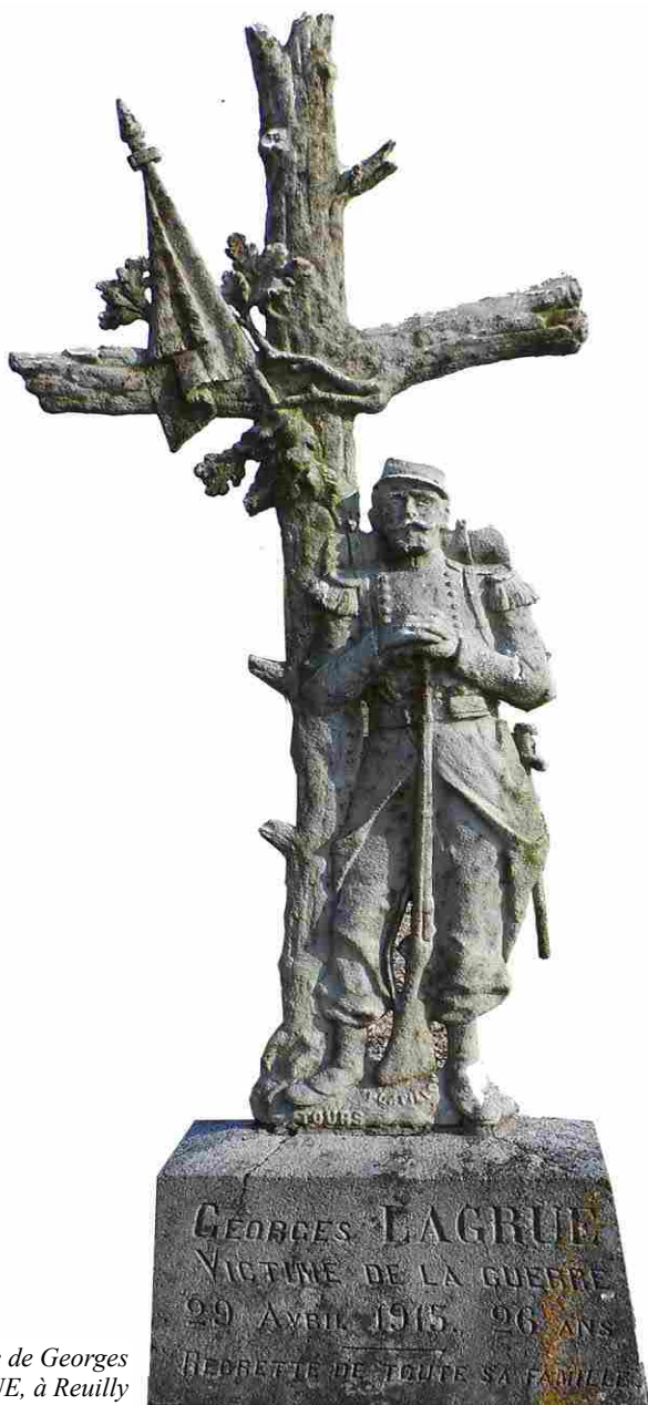
Tombe de Georges LAGRUE, à Reuilly

Il faut également noter que les plaques militaires ne sont pas uniquement sur les tombes mais peuvent également être posées à l'intérieur des églises, notamment à proximité d'une statue de la Vierge, en signe de dévotion.