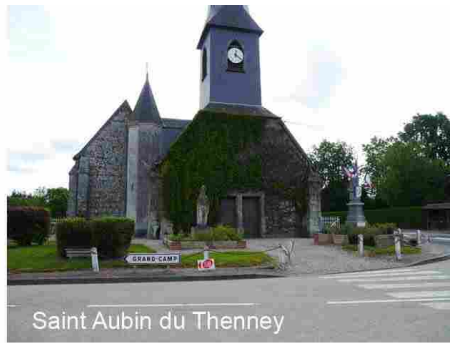
Saint Aubin du Thenney