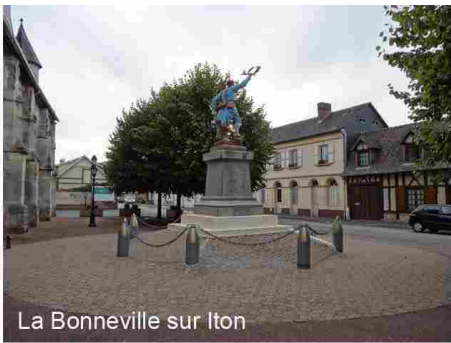
La Bonneville sur Iton

Les monuments aux morts à l'intérieur du cimetière, collés au mur du cimetière ou sur la place du village