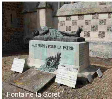
Fontaine la Soret