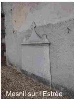
Mesnil sur l'Estrée

Les plaques commémoratives à l'intérieur ou à l'extérieur des églises