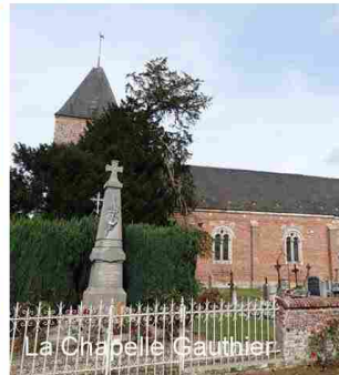
La Chapelle Gauthier