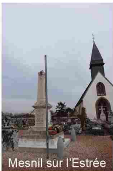
Mesnil sur l'Estrée