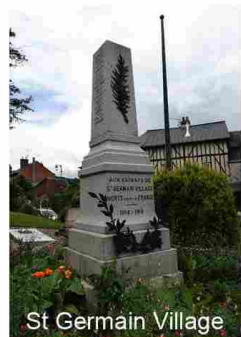
St Germain Village