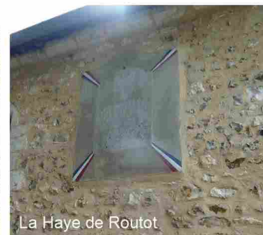
La Haye de Routot