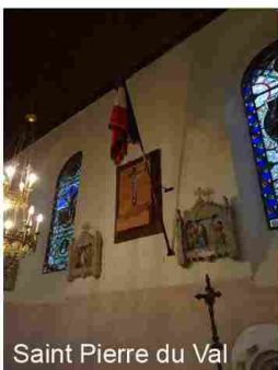
Saint Pierre du Val

Les drapeaux français à l'intérieur des églises