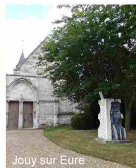
Jouy sur Eure

Les plaques commémoratives à l'intérieur ou à l'extérieur des églises