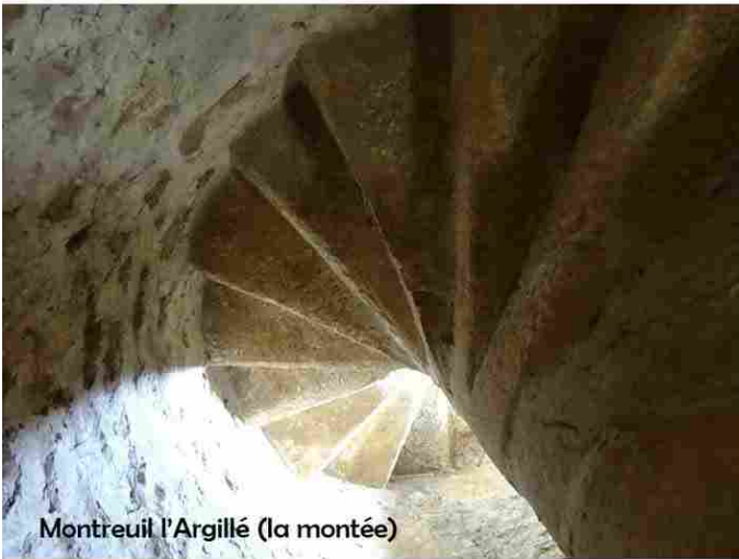
Montreuil l'Argillé (la montée)