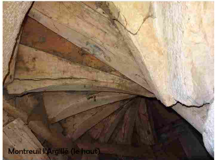
Montreuil l'Argillé (le haut)