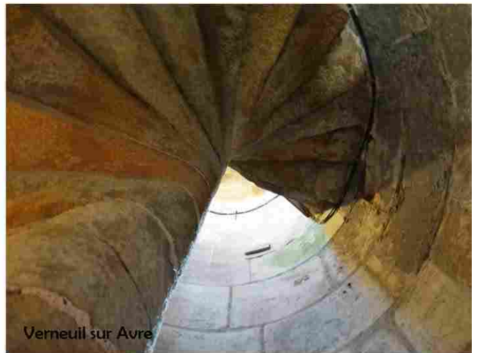
Verneuil sur Avre