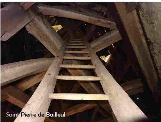
Saint Pierre de Bailleul