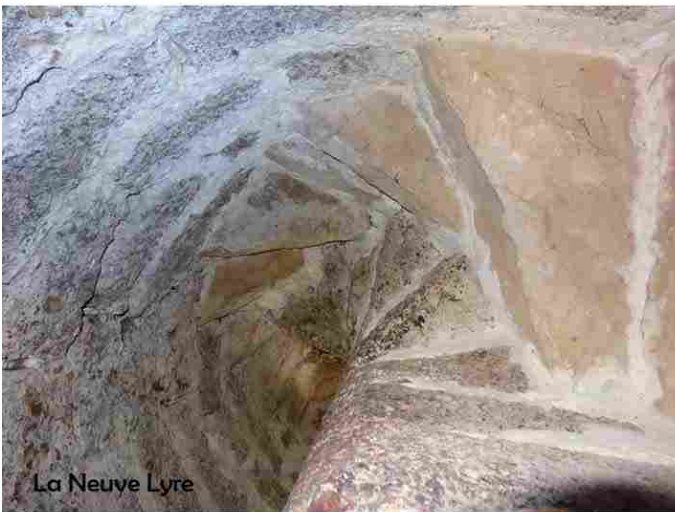
La Neuve Lyre