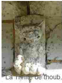
La Trinité de Thoub.