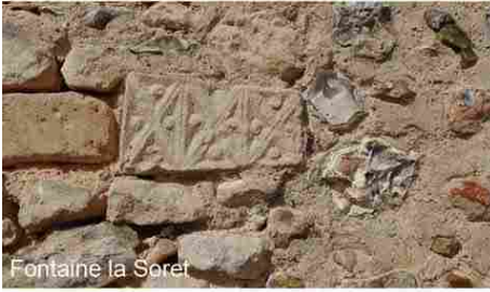
Fontaine la Soret