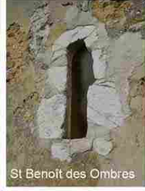
St Benoit des Ombres