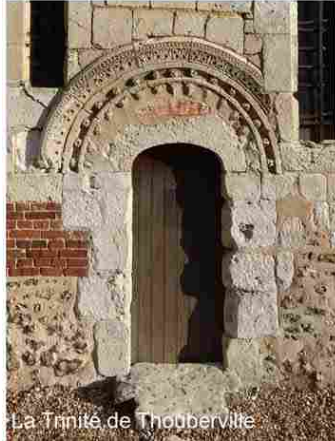
La Trinité de Thouberville