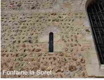
Fontaine la Soret