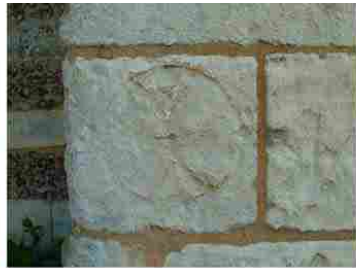
Le Tilleul Othon