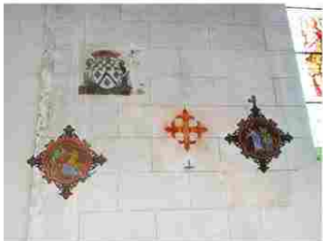
Saint Aubin sur Gaillon