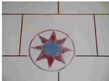
Thomer la Sogne