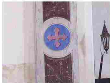
Gisay la Coudre