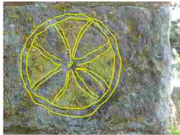
Le Tilleul Othon