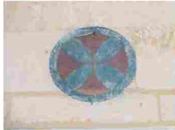
Le tilleul Othon