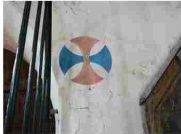
Illeville sur Montfort