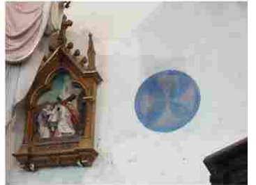
Le Tilleul Othon