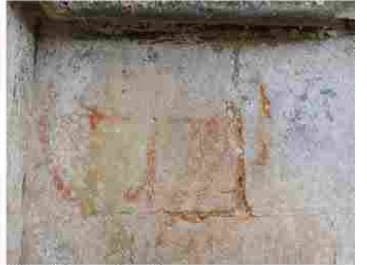
Tilleul Dame Agnès