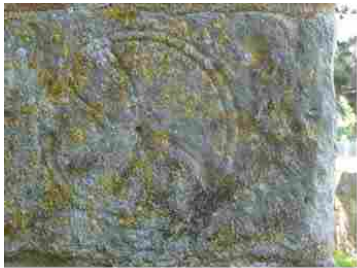
Le Tilleul Othon