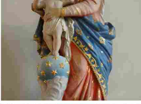
Etoiles parsemées dans les tissus, sculptures et fonds