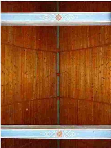
Le Thil en Vexin