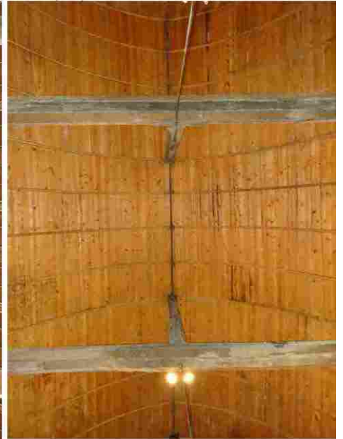
Bailleur la Vallée