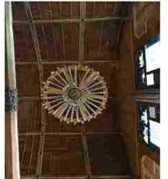
Doudeauville en Ve