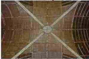
Doudeauville en Vexin