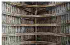
Saint Benoît des Ombres