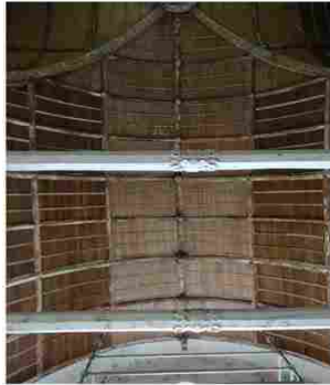
Doudeauville en Vexin