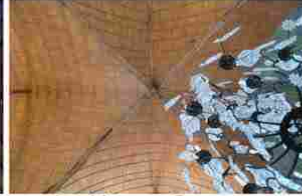
La Neuve Grange