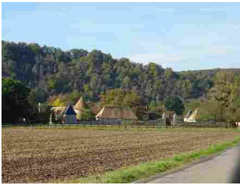
Le manoir vu depuis la route à l'Est