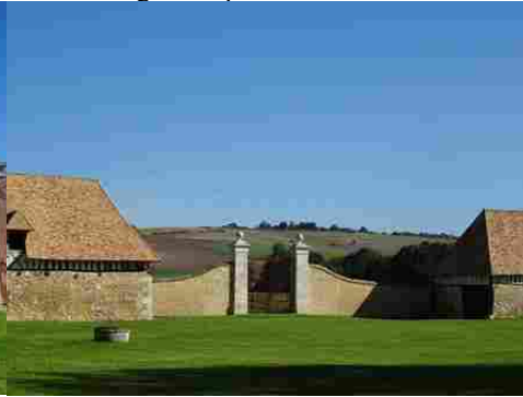
La vue vers les collines cultivées à l'Est