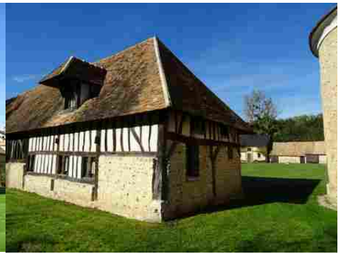
Une ancienne grange