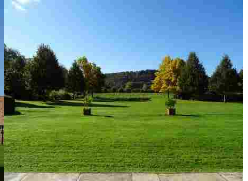
La vue vers l'Eure et ses côteaues boisés

Pour la zone en rose foncé dans le périmètre de 500m Il est préférable d'éviter les constructions qui viendraient au dessus de la ligne de paysage existante (maison à deux niveaux, bâtiments agricoles de type silo, château d'eau, éolienne...).