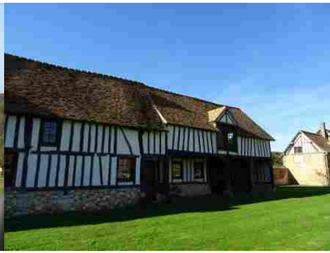
L'ancien logis d'exploitation du domaine