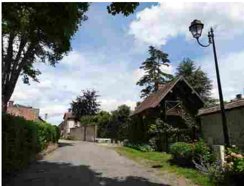
Une rue de Cailly

Pour le reste du périmètre de 500m Les avis seront cohérents avec ceux émis ces derniers années, à savoir : pas de maisons à volume compliqué (type V, W, Y, ou Z), pentes à 45° pour les volumes principaux, ardoise ou tuile plate de teinte brun vieilli, à 20u/m 2 , avec un débord de toiture de 20cm, enduit de teinte beige clair avec modénatures (au choix : chaînages, encadrement de fenêtres, soubassement, colombage...). *Voir les autres fiches.