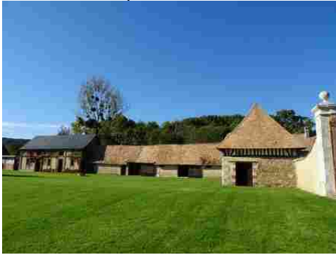
La cour enherbée du manoir