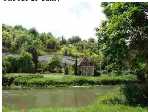
La rivière d'Eure et ses côteaues