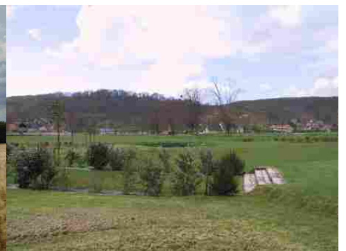
Les prairies et le village de Cailly