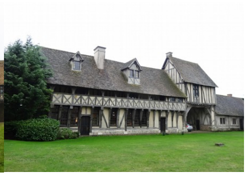
Le bâtiment d'entrée avec sa galerie