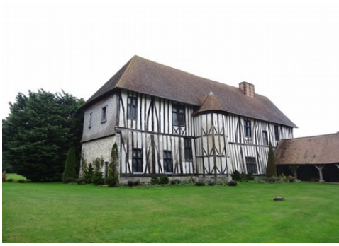
La façade sud du manoir