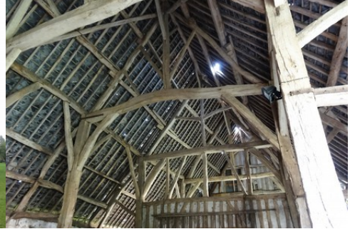
La charpente de la grange

Pour la zone en rose foncé dans le périmètre de 500m