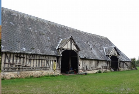
La grange à pans de bois et toiture haute