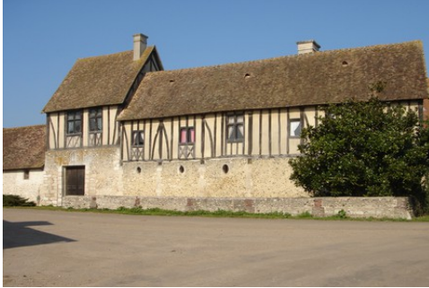
Le bâtiment d'entrée depuis la rue