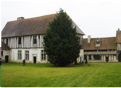
Le manoir vu du Nord