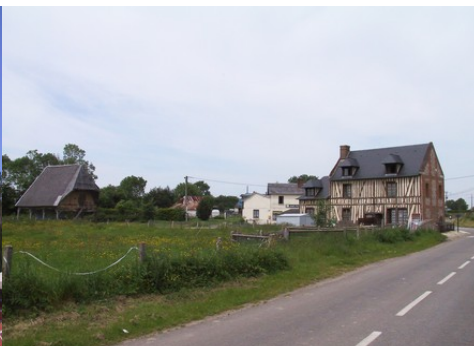
Des exemples d'architecture rurale