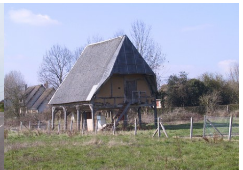
Quelques maisons dans les abords