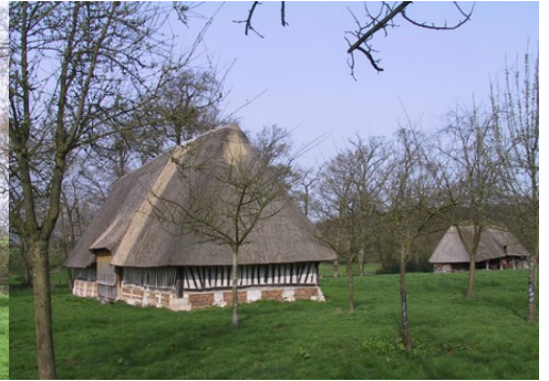
Les anciens bâtiments agricoles

Pour la zone en rose foncé dans le périmètre de 500m