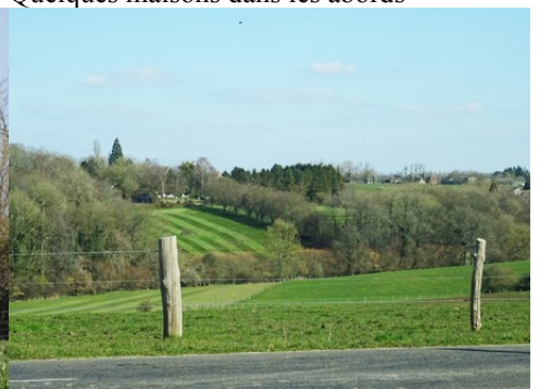
Le paysage rural environnant