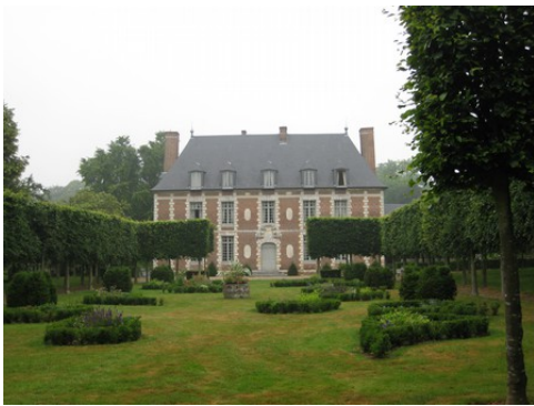
Le château et son parc