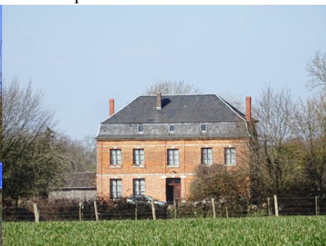
Une maison en briques