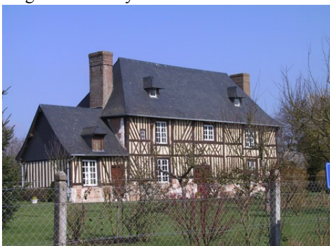
Une maison à pans de bois