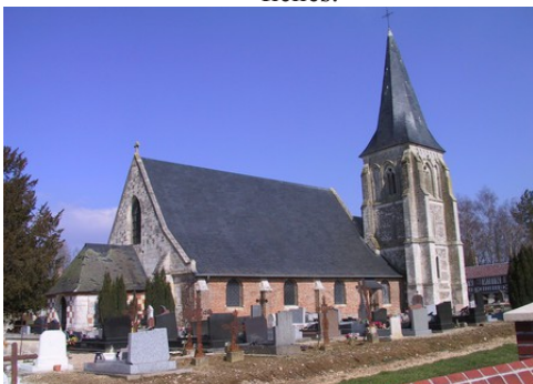
L'église de la Haye Aubrée

Les avis seront cohérents avec ceux émis ces dernières années, à savoir : pas de maisons à volume compliqué (type V, W, Y, ou Z), Rez-de-chaussée + Combles, pentes à 45° pour les volumes principaux, ardoise ou tuile plate de teinte brun vieilli, à 20u/m², avec un débord de toiture de 20cm, enduit de teinte beige clair avec modénatures (au choix : chaînages, encadrement de fenêtres, soubassement, colombage...). *Voir les autres fiches.