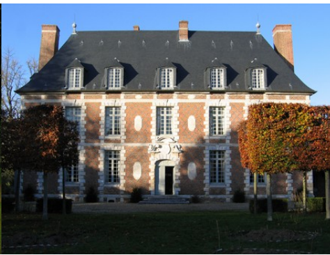
La façade sud (vue rapprochée)