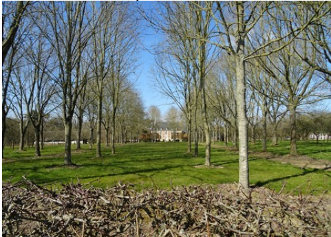
Le château vu de la route