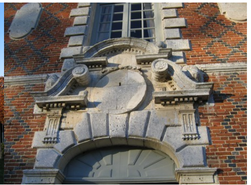
Le détail du fronton d'entrée