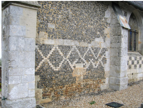
Des détails d'appareillage de l'église