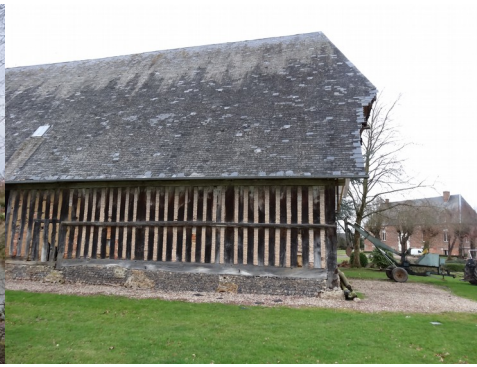
Une vue de la grange avant réfection