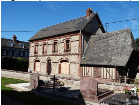
Une maison mêlant moellons, briques