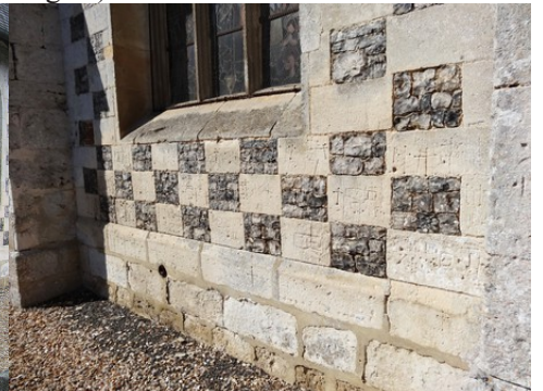
Un appareil en damier pierre-silex