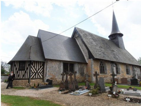
L'église d'Epreville en Lieuvain (inscrite)

Les avis seront cohérents avec ceux émis ces dernières années, à savoir : pas de maisons à volume compliqué (type V, W, Y, ou Z), pentes à 45° pour les volumes principaux, ardoise ou tuile plate de teinte brun vieilli, à 20u/m 2 , avec un débord de toiture de 20cm, enduit de teinte beige clair avec modénatures (au choix : chaînages, encadrement de fenêtres, soubassement, colombage...). *Voir les autres fiches.