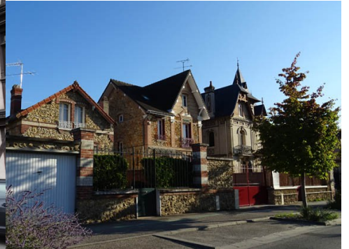
Des maisons en meulière