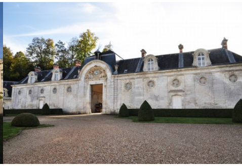
Les écuries XVIII e