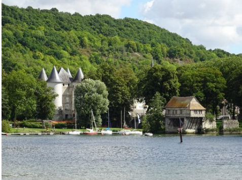
Le château des Tourelles et la Seine