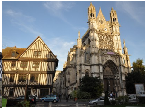
La collégiale de Vernon