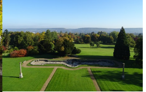
La vue vers le parc et les coteaux à l'Est