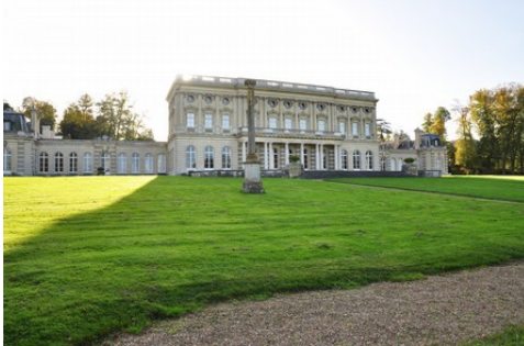
La façade nord depuis le parc