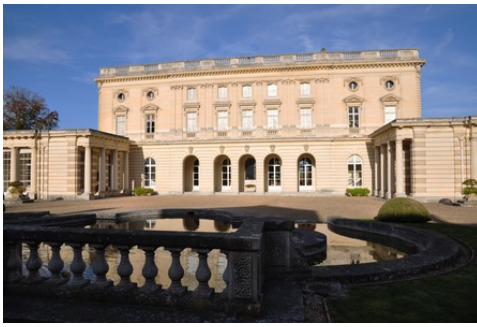
La façade sud du château depuis la cour