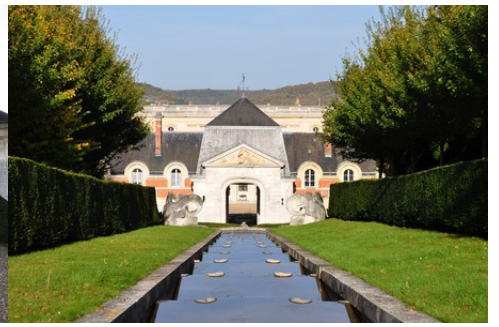
La cascade d'eau vers les écuries