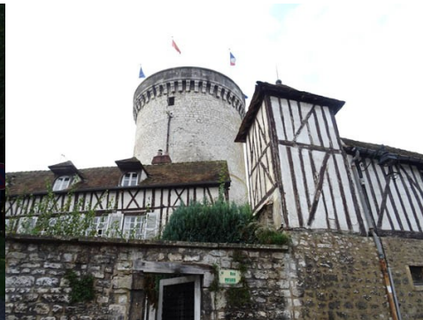
La tour des archives