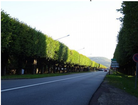
L'avenue plantée des Capucins

Le centre-ville est tenu dans les anciennes fortifications (plus ou moins visibles) et il faut veiller à une architecture de qualité. Tout particulièrement sur les berges de Seine, à la fois parce qu'il s'agit de la porte d'entrée de Vernon mais également parce qu'elles sont vues depuis la rive Nord et les autres monuments historiques.