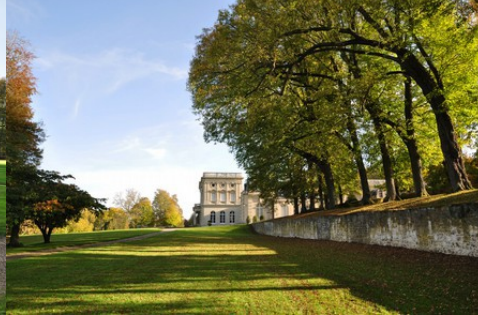
La façade ouest depuis le parc