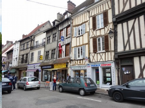
Les maisons à pans de bois du centre-ville