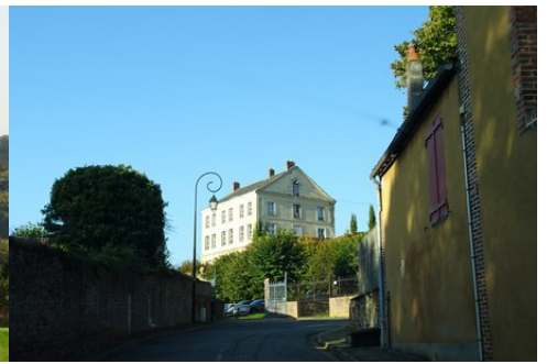
La maison XIX e bâtie sur le château