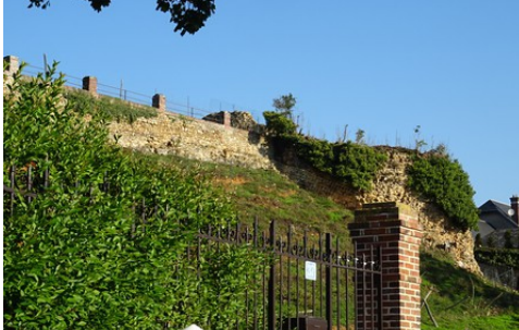
Les anciennes fortifications