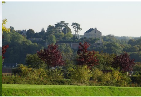
Le château depuis le Sud (vue lointaine)