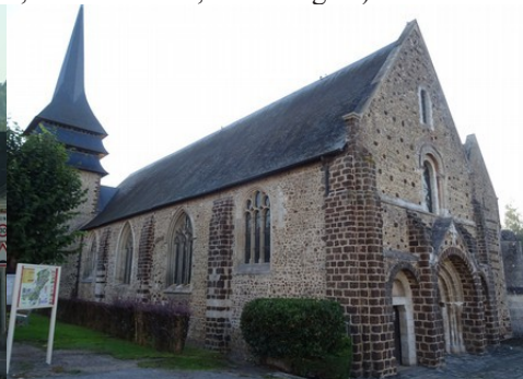
L'église de Tillières