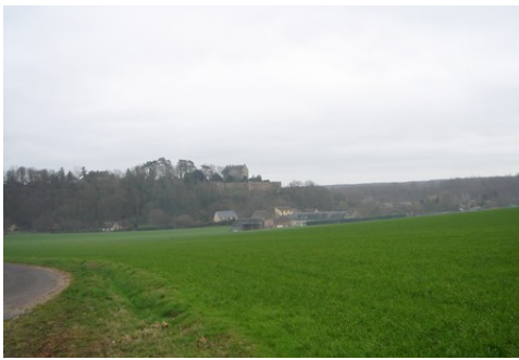
Une vue éloignée du château de l'Ouest