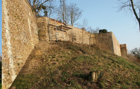
Les anciens murs de soutènement