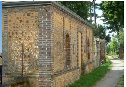
Un exemple d'architecture rurale