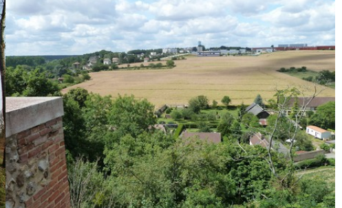
La vue vers le Sud-Ouest