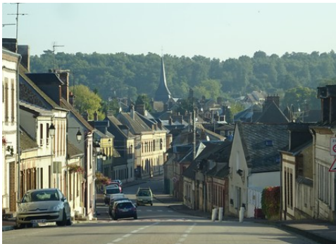
La vue du bourg de Tillières

Les avis seront cohérents avec ceux émis ces dernières années, à savoir : pas de maisons à volume compliqué (type V, W, Y, ou Z), pentes à 45° pour les volumes principaux, ardoise ou tuile plate de teinte brun vieilli, à 20u/m 2 , avec un débord de toiture de 20cm, enduit de teinte beige clair avec modénatures (au choix : chaînages, encadrement de fenêtres, soubassement, colombage...). *Voir les autres fiches.