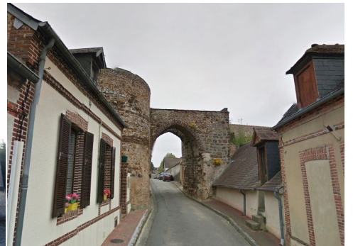
L'ancienne porte fortifiée du bourg