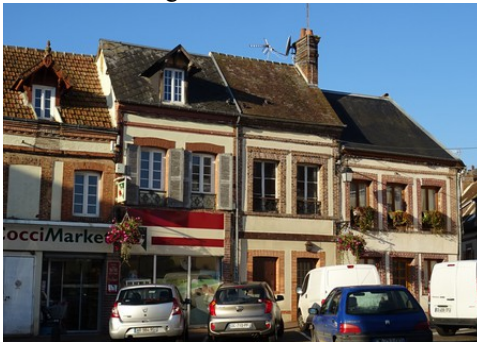
Quelques maisons dans les abords