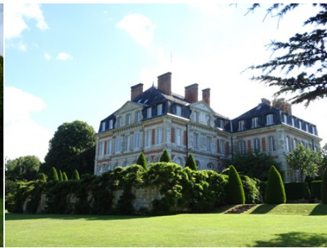
Le château vu depuis le Nord-Est