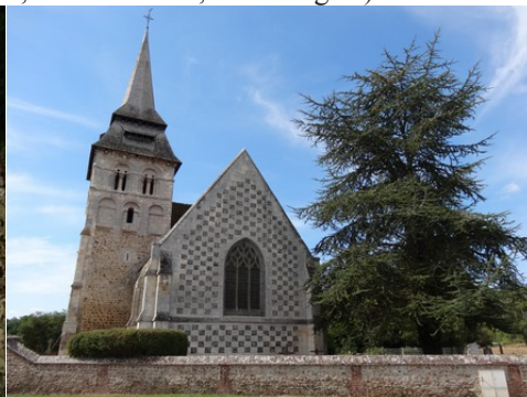
L'église de Fontaine la Soret