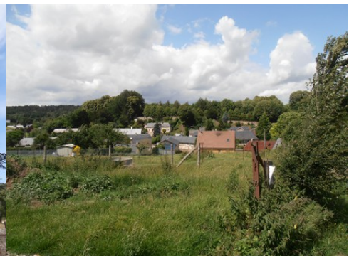
Le village de Fontaine la Soret