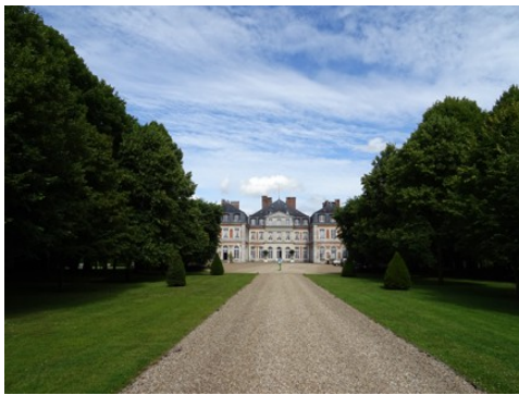
La façade est avec l'allée d'honneur