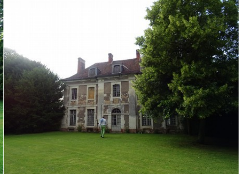
Une dépendance du château

Pour la zone en rose foncé dans le périmètre de 500m