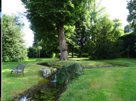
Le cours d'eau traversant le domaine