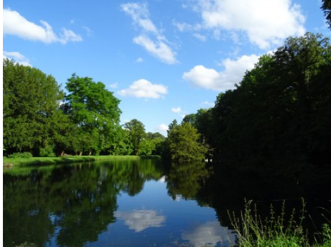
L'étang du parc