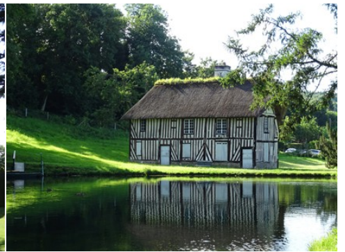
Un pavillon du parc au bord de l'étang