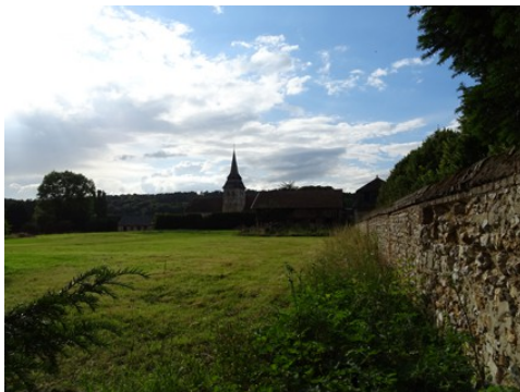
L'église vue du domaine

Les avis seront cohérents avec ceux émis ces dernières années, à savoir : pas de maisons à volume compliqué (type V, W, Y, ou Z), pentes à 45° pour les volumes principaux, ardoise ou tuile plate de teinte brun vieilli, à 20u/m 2 , avec un débord de toiture de 20cm, enduit de teinte beige clair avec modénatures (au choix : chaînages, encadrement de fenêtres, soubassement, colombage...). *Voir les autres fiches.