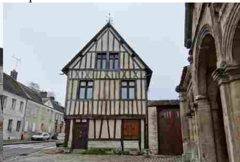
Une maison à pans de bois