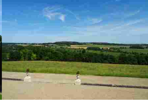
La vue lointaine vers l'Est