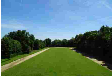
La perspective vers le Sud