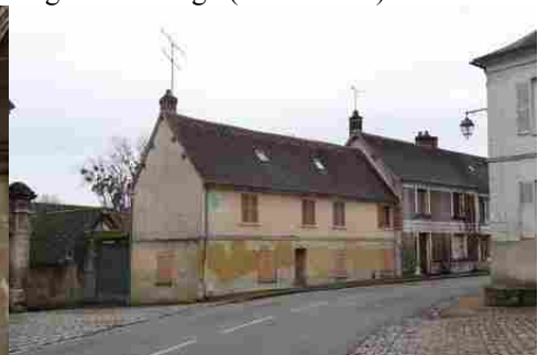
Une maison en pierre de taille