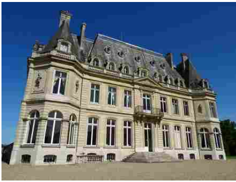
La façade ouest du château