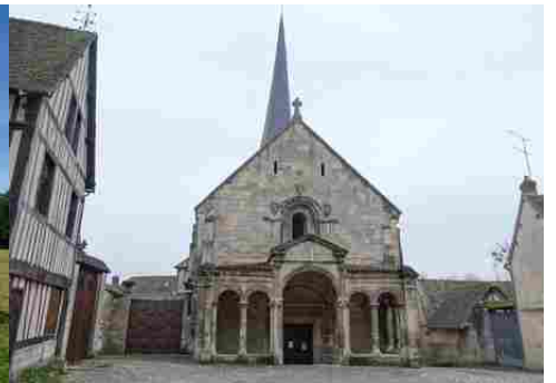
L'église de Dangu (classée MH)