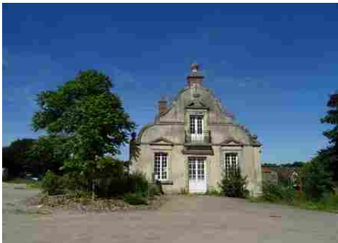
Un ancien commun voisin du château

Les avis seront cohérents avec ceux émis ces dernières années, à savoir : pas de maisons à volume compliqué (type V, W, Y, ou Z), pentes à 45° pour les volumes principaux, ardoise ou tuile plate de teinte brun vieilli, à 20u/m 2 , avec un débord de toiture de 20cm, enduit de teinte beige clair avec modénatures (au choix : chaînages, encadrement de fenêtres, soubassement, colombage...). *Voir les autres fiches.