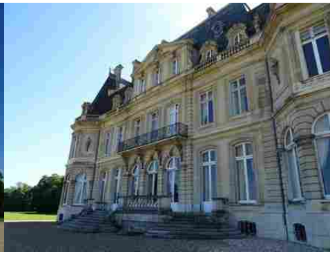
La façade est du château