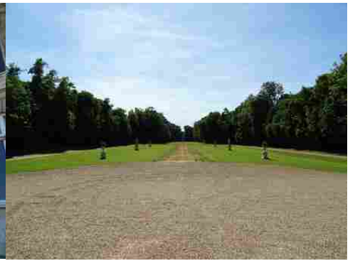
La perspective vers l'Ouest