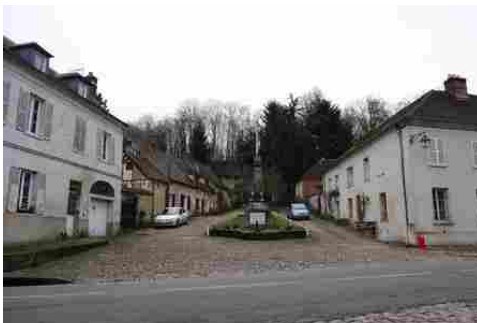
Quelques maisons dans les abords