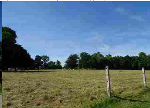
Une prairie aux alentours