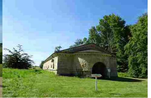
L'ancien château d'eau du XVIII e siècle

Pour la zone en rose foncé dans le périmètre de 500m