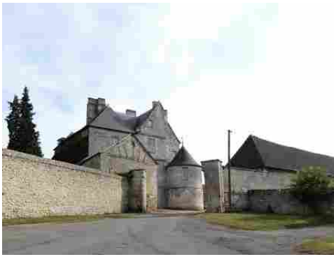
Le portail d'entrée du manoir