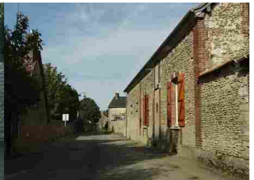
Le bâti rural avoisinant