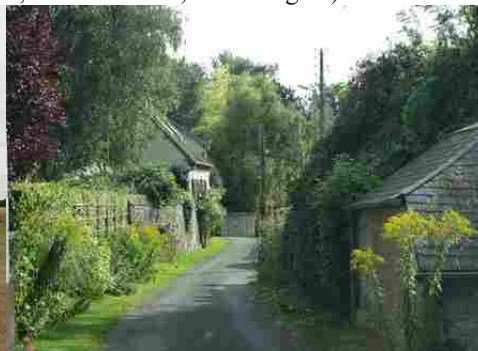
Une rue de Bus-Saint-Rémy