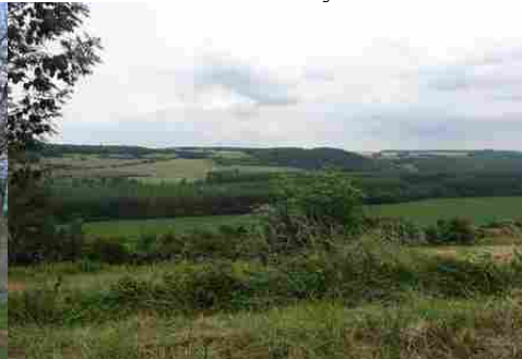
Le paysage autour de la vallée de l'Epte