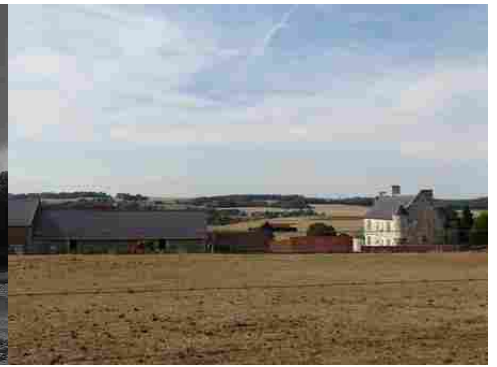
La vue vers l'Ouest avec le manoir