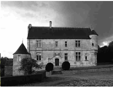
La façade sud-ouest du manoir