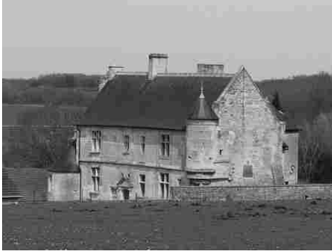
Le manoir vu depuis l'Ouest