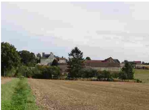
Le village et le manoir vus du Nord-Ouest

Les avis seront cohérents avec ceux émis ces dernières années, à savoir : pas de maisons à volume compliqué (type V, W, Y, ou Z), pentes à 45° pour les volumes principaux, ardoise ou tuile plate de teinte brun vieilli, à 20u/m 2 , avec un débord de toiture de 20cm, enduit de teinte beige clair avec modénatures (au choix : chaînages, encadrement de fenêtres, soubassement, colombage...). *Voir les autres fiches.