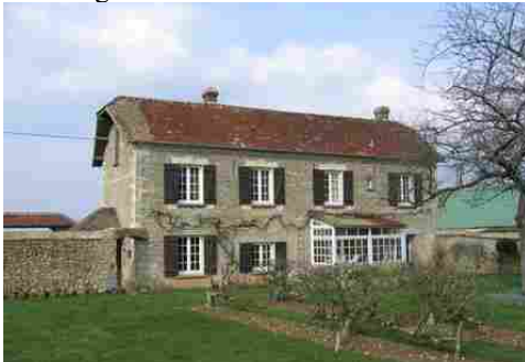
Un exemple de maison (moellons, tuiles)