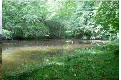
Les berges de l'Epte