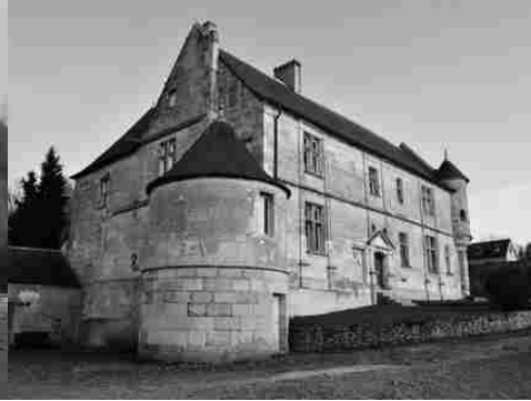
La tour basse à l'angle nord-est