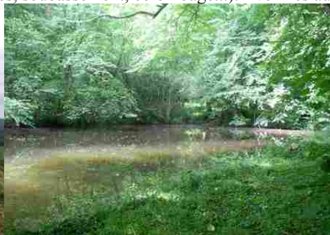
Les berges de l'Epte