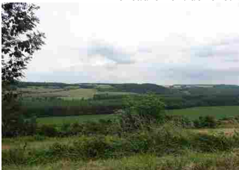
Le paysage de la vallée de l'Epte

Les avis seront cohérents avec ceux émis ces derniers années, à savoir : pas de maisons à volume compliqué (type V, W, Y, ou Z), pentes à 45° pour les volumes principaux, ardoise ou tuile plate de teinte brun vieilli, à 20u/m 2 , avec un débord de toiture de 20cm, enduit de teinte beige clair avec modénatures (au choix : chaînages, encadrement de fenêtres, soubassement, colombage...). *Voir les autres fiches.