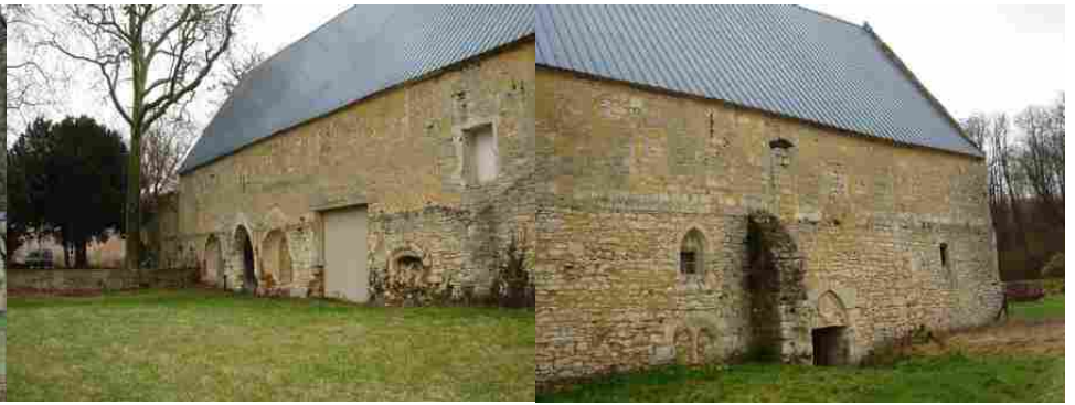
Le bâtiment des moniales