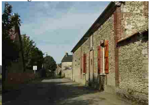
Le bâti rural alentours