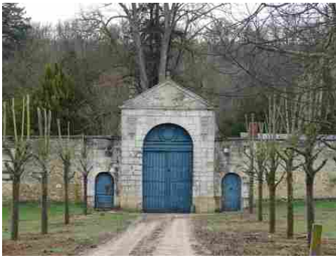
Le portail d'entrée de l'abbaye