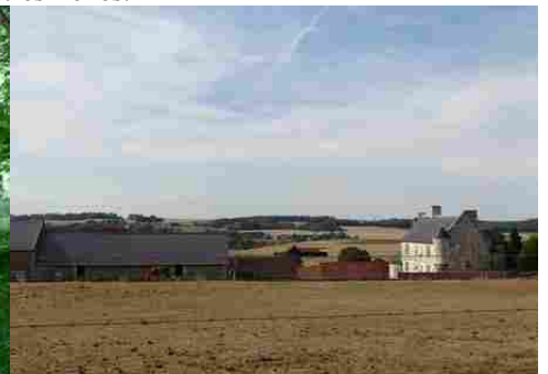
Le village du Bus et son manoir