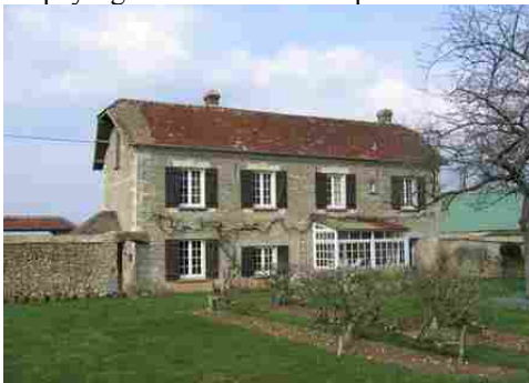
Un exemple de maison (moellons, tuiles)