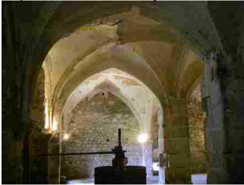
Les anciennes salles voûtées