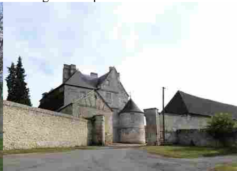
Le manoir du Bus Saint Rémy (inscrit)