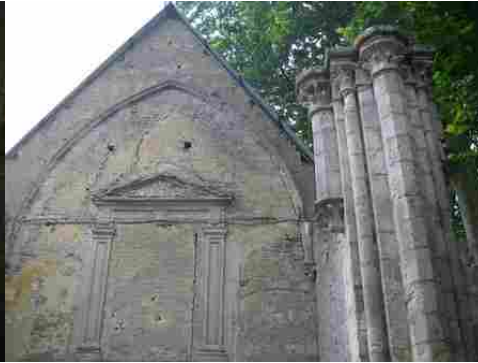
Des vestiges de l'église abbatiale