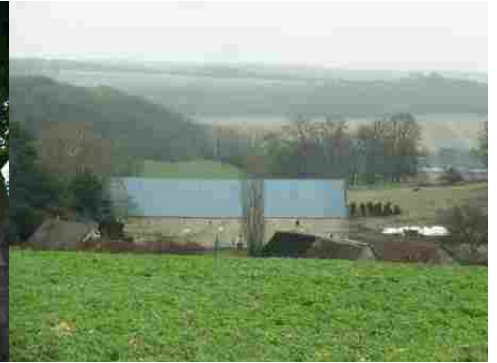
L'abbaye vue depuis la route à l'Est