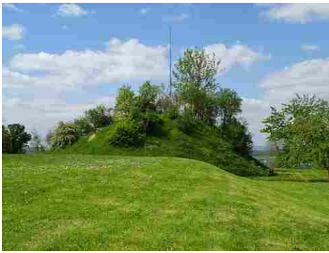
La motte vue de l'Est