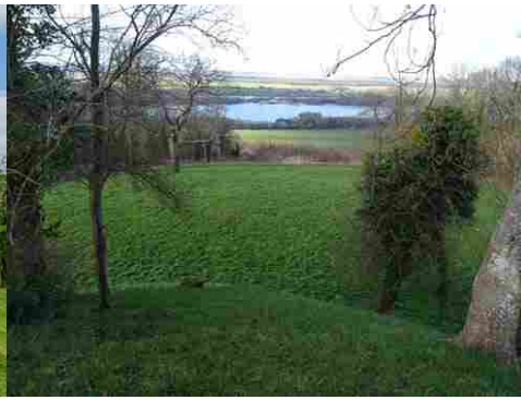
La vue sur la Seine et le village de Muids