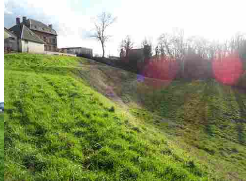
Les anciens fossés vers le Nord-Ouest

Pour la zone en rose foncé dans le périmètre de 500m