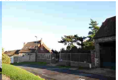
Des maisons en briques ou en moellons