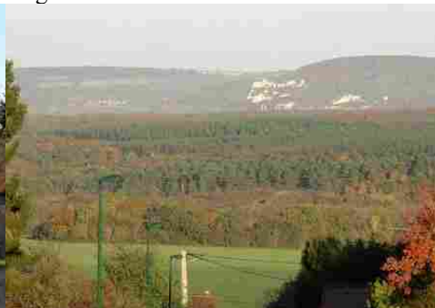
Château Gaillard vu du village