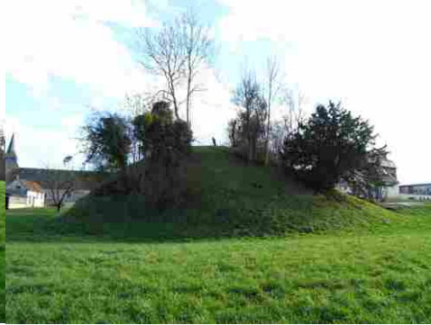
La motte vue de l'Ouest