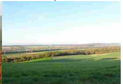
Le cadre rural de la vallée de la Seine