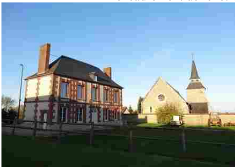
Le cadre bâti à proximité de la motte

Les avis seront cohérents avec ceux émis ces dernières années, à savoir : pas de maisons à volume compliqué (type V, W, Y, ou Z), pentes à 45° pour les volumes principaux, ardoise ou tuile plate de teinte brun vieilli, à 20u/m 2 , avec un débord de toiture de 20cm, enduit de teinte beige clair avec modénatures (au choix : chaînages, encadrement de fenêtres, soubassement, colombage...). *Voir les autres fiches.