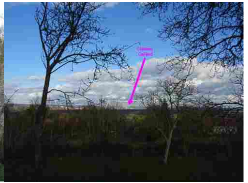
La vue lointaine vers Château Gaillard