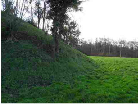
La motte vue du pied