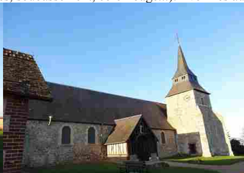
L'église de Venables