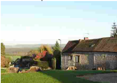
Le village en position dominante