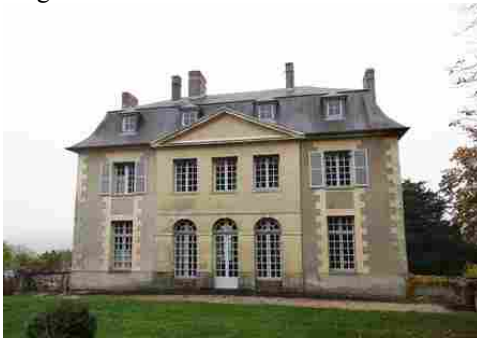
L'ancien pavillon de chasse de Gaillon