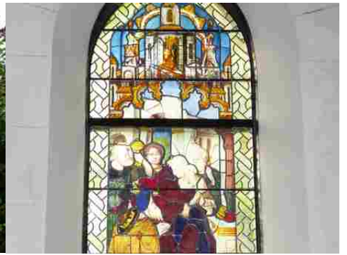
Le détail d'un ancien vitrail XVI e