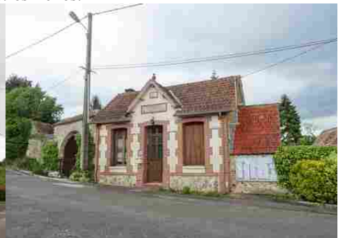
La mairie (briques, moellons, enduit)