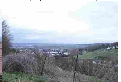
La vue vers la vallée de la Seine