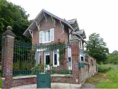
La maison à l'entrée du parc