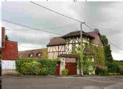
Une maison à pans de bois