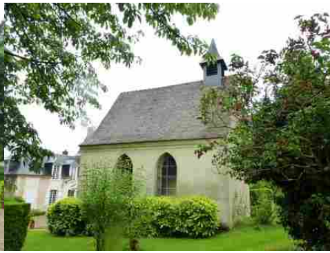
La façade nord de la chapelle