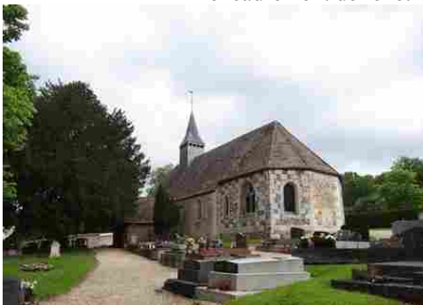
L'église de Sainte-Barbe sur Gaillon

Les avis seront cohérents avec ceux émis ces dernières années, à savoir : pas de maisons à volume compliqué (type V, W, Y, ou Z), pentes à 45° pour les volumes principaux, ardoise ou tuile plate de teinte brun vieilli, à 20u/m 2 , avec un débord de toiture de 20cm, enduit de teinte beige clair avec modénatures (au choix : chaînages, encadrement de fenêtres, soubassement, colombage...). *Voir les autres fiches.