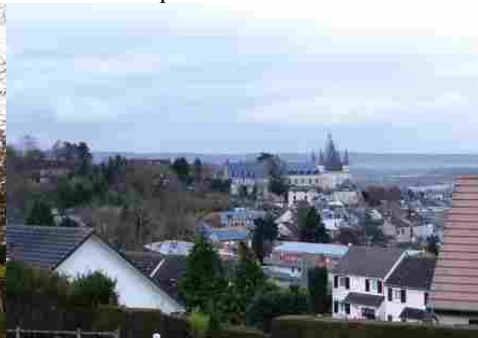
Gaillon vu depuis Sainte-Barbe