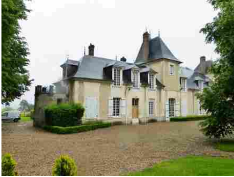
Le château de Courtmoulin