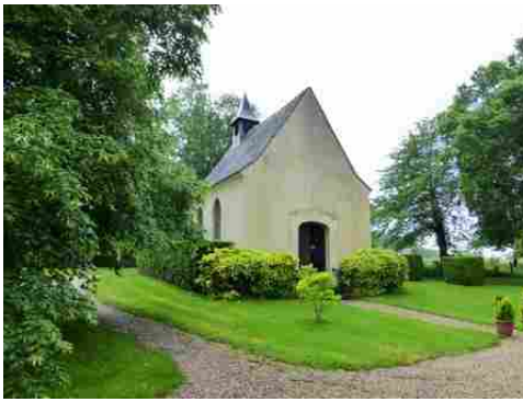
La façade d'entrée (Est) de la chapelle