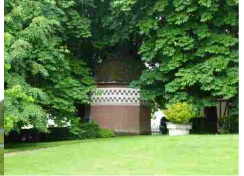
Le colombier en briques

Pour la zone en rose foncé dans le périmètre de 500m