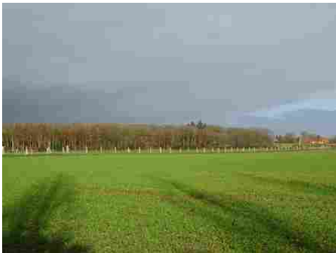
Les champs et les bois autour du domaine

Les avis seront cohérents avec ceux émis ces derniers années, à savoir : pas de maisons à volume compliqué (type V, W, Y, ou Z), pentes à 45° pour les volumes principaux, ardoise ou tuile plate de teinte brun vieilli, à 20u/m 2 , avec un débord de toiture de 20cm, enduit de teinte beige clair avec modénatures (au choix : chaînages, encadrement de fenêtres, soubassement, colombage...). *Voir les autres fiches.