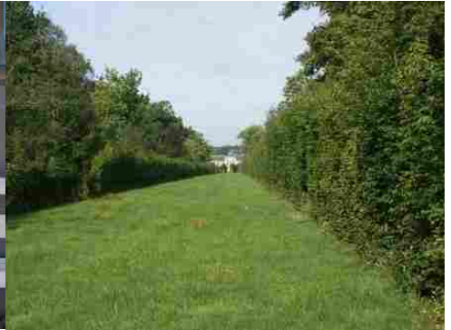
Une perspective sur le château