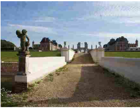
L'accès au château