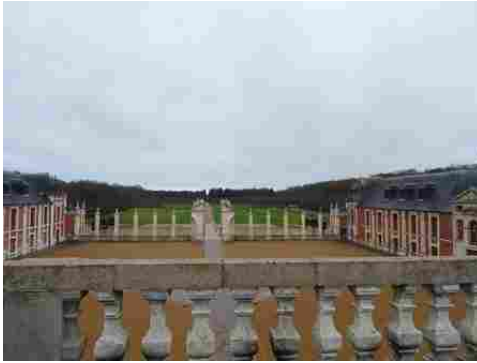
La cour d'honneur (vue vers l'Ouest)