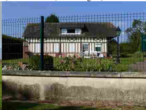
Le bâti rural à pans de bois