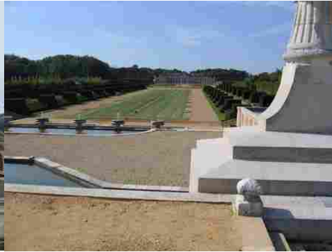
Les jardins et la perspective vers l'Est