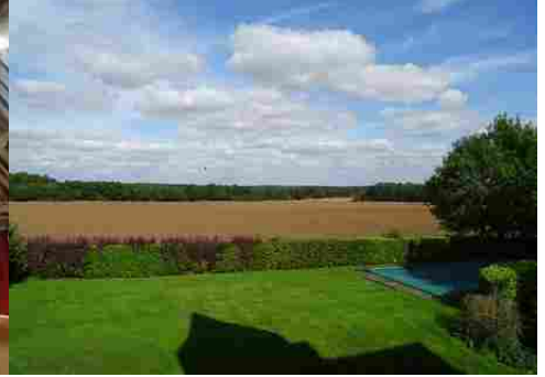
La vue vers les champs au Nord

Pour la zone en rose foncé dans le périmètre de 500m