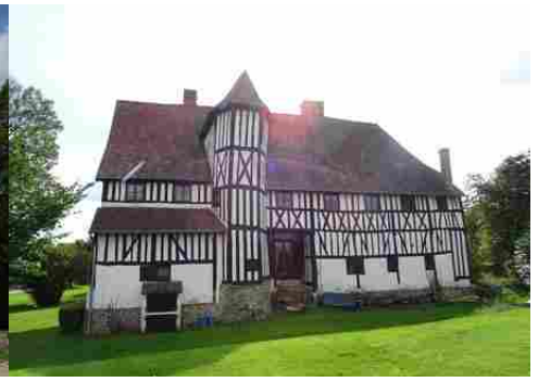
La façade nord avec la tour d'escalier