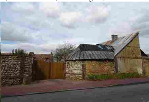
Un portail d'entrée