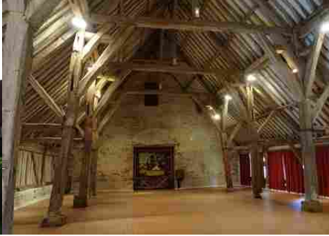
La charpente de la grange