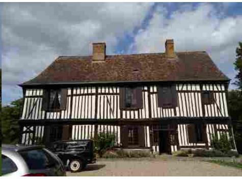
La façade sud du manoir (vue proche)