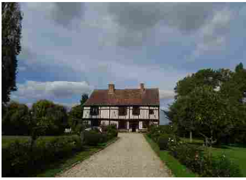
La façade sud du manoir (vue éloignée)