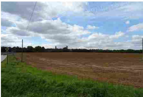
Le domaine vu de la lisière du village

Les avis seront cohérents avec ceux émis ces dernières années, à savoir : pas de maisons à volume compliqué (type V, W, Y, ou Z), pentes à 45° pour les volumes principaux, ardoise ou tuile plate de teinte brun vieilli, à 20u/m 2 , avec un débord de toiture de 20cm, enduit de teinte beige clair avec modénatures (au choix : chaînages, encadrement de fenêtres, soubassement, colombage...). *Voir les autres fiches.