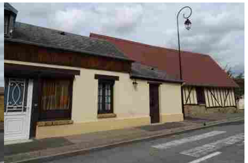
Le bâti rural avoisinant