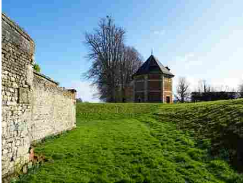
Le colombier octogonal vu des fossés