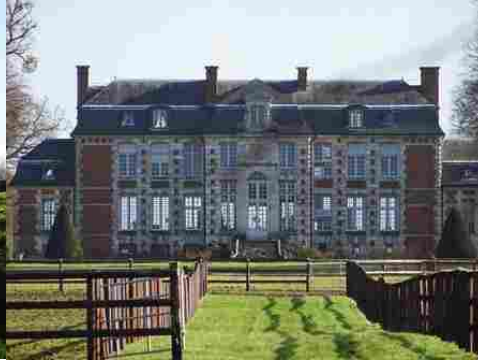
La façade nord (vue éloignée)