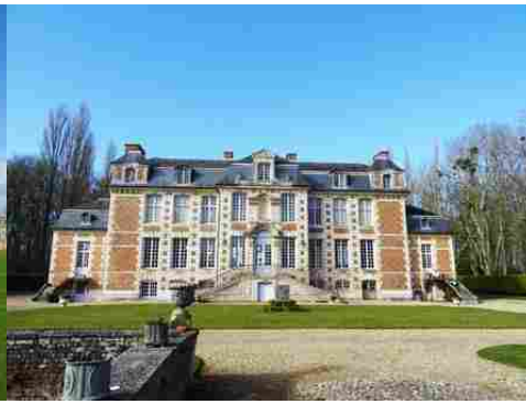
La façade sud sur la cour d'honneur