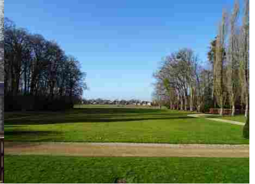
La perspective vers le village, au Nord

Pour la zone en rose foncé dans le périmètre de 500m