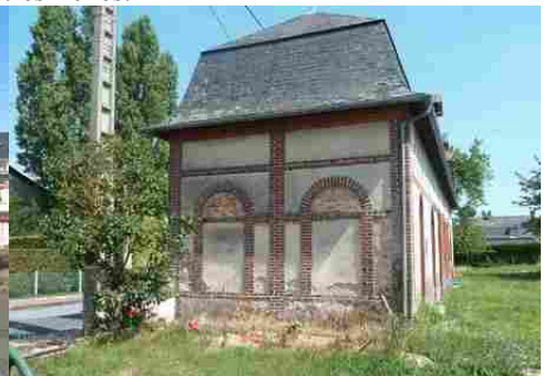
Un pignon avec briques et enduit