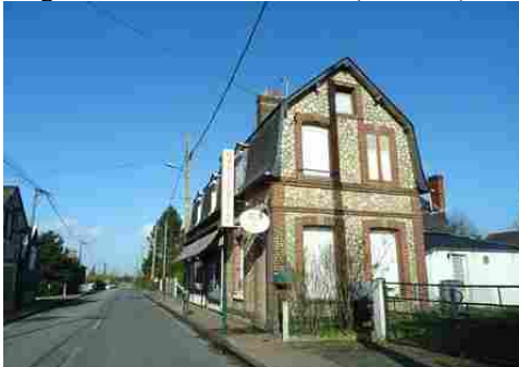
Une maison mêlant briques et moellons