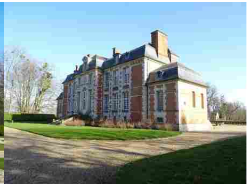
La façade nord (vue proche)