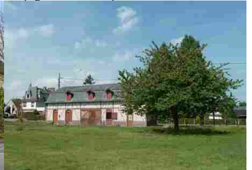
Le paysage rural autour de Saint-Maclou