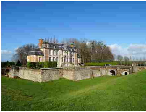
Le château et ses fossés vu du Sud