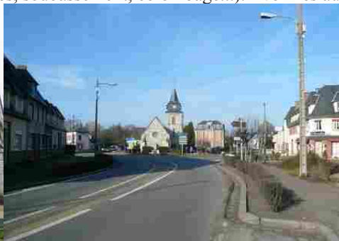
L'environnement de l'église