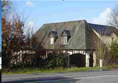
Une maison à pans de bois et toiture haute