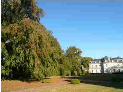
La façade ouest et le parc arboré