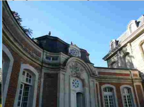
La galerie sud du château