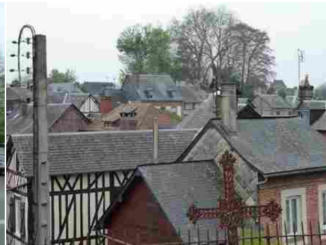
La vue depuis le cimetière