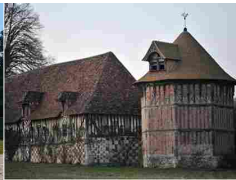
Les communs et le colombier