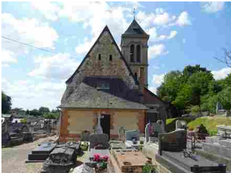
L'église de Saint Georges du Vièvre

Les avis seront cohérents avec ceux émis ces dernières années, à savoir : pas de maisons à volume compliqué (type V, W, Y, ou Z), pentes à 45° pour les volumes principaux, ardoise ou tuile plate de teinte brun vieilli, à 20u/m 2 , avec un débord de toiture de 20cm, enduit de teinte beige clair avec modénatures (au choix : chaînages, encadrement de fenêtres, soubassement, colombage...). *Voir les autres fiches.