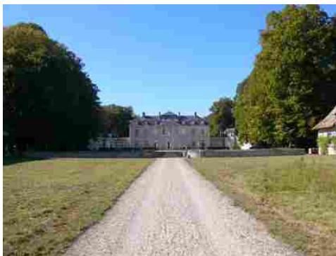
La façade est du château (vue lointaine)