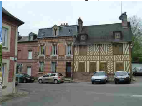
Deux maisons en briques et en colombage