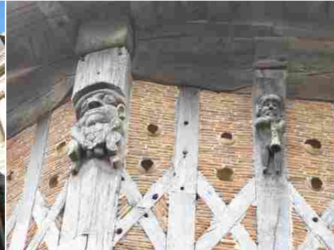
Les poteaux sculptés du colombier