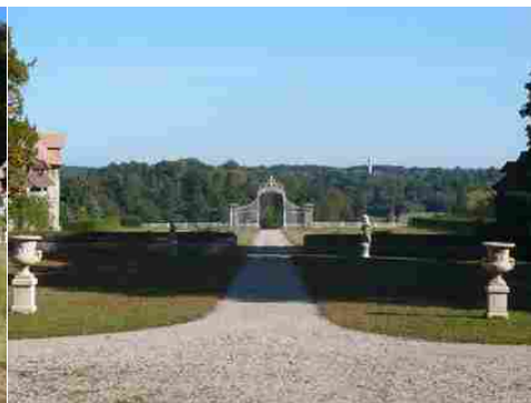
La perspective est avec la grille d'entrée