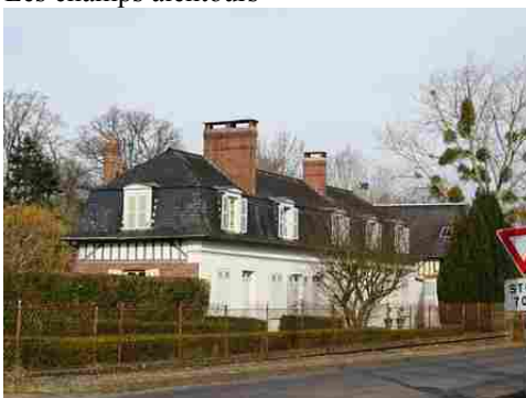
Une maison à combles brisés