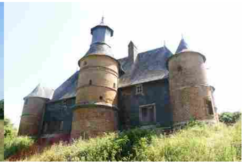
La façade ouest avec la tour d'escalier