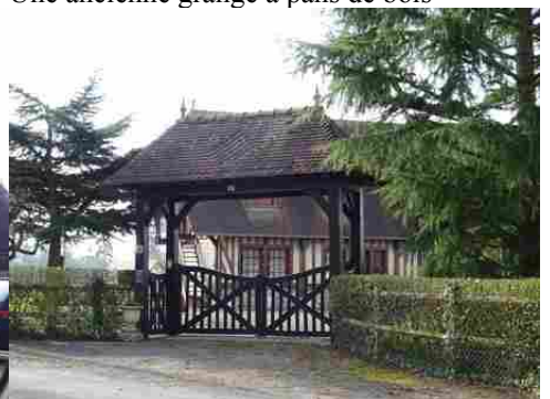
Un portail couvert en bois