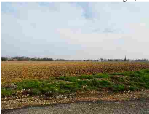
Les champs alentours

Les avis seront cohérents avec ceux émis ces dernières années, à savoir : pas de maisons à volume compliqué (type V, W, Y, ou Z), pentes à 45° pour les volumes principaux, ardoise ou tuile plate de teinte brun vieilli, à 20u/m 2 , avec un débord de toiture de 20cm, enduit de teinte beige clair avec modénatures (au choix : chaînages, encadrement de fenêtres, soubassement, colombage...). *Voir les autres fiches.