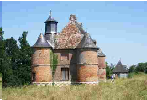
Le manoir vu du Sud