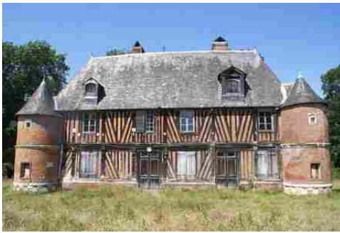
La façade est du manoir (vue proche)