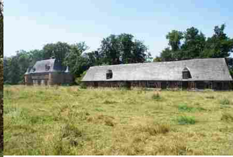
Le manoir et ses dépendances