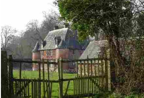
Le manoir vu du chemin du Vièvre