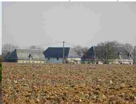
Le bâti rural depuis les champs