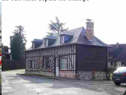
Une façade à pans de bois