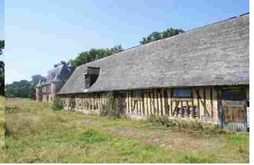
Les dépendances (vue rapprochée)

Pour la zone en rose foncé dans le périmètre de 500m