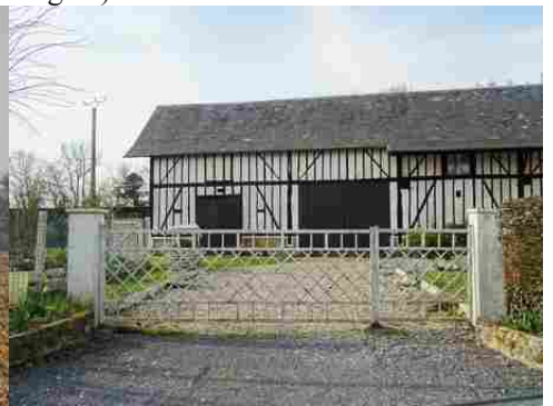
Une ancienne grange à pans de bois