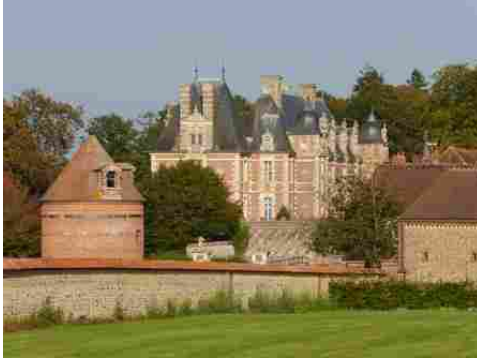
Le colombier, le château vus de l'Ouest