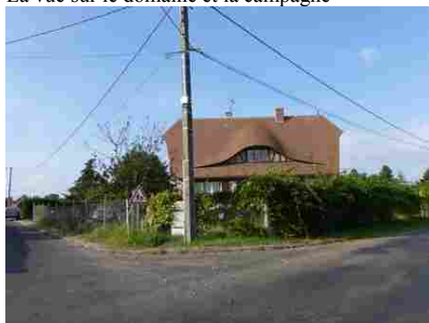
Quelques maisons de Gouville