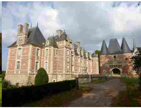
La poterne d'entrée depuis l'Ouest