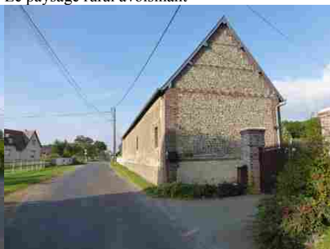
Un pignon en briques et en moellons