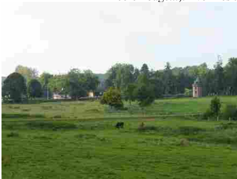
La vue sur le domaine et la campagne

Les avis seront cohérents avec ceux émis ces dernières années, à savoir : pas de maisons à volume compliqué (type V, W, Y, ou Z), pentes à 45° pour les volumes principaux, ardoise ou tuile plate de teinte brun vieilli, à 20u/m 2 , avec un débord de toiture de 20cm, enduit de teinte beige clair avec modénatures (au choix : chaînages, encadrement de fenêtres, soubassement, colombage...). *Voir les autres fiches.