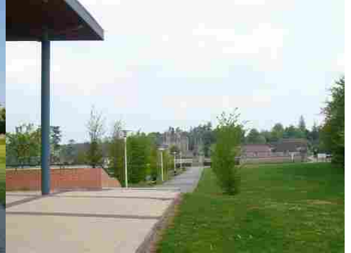
Le château vu du lycée agricole

Pour la zone en rose foncé dans le périmètre de 500m