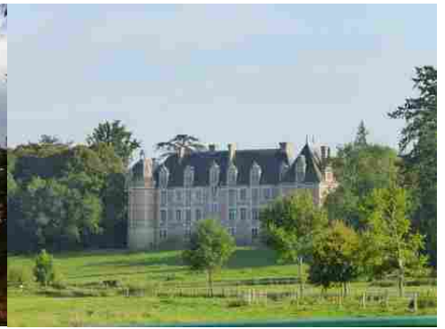
La façade nord (vue éloignée)