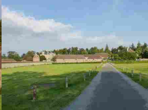
L'accès aux communs depuis l'Ouest