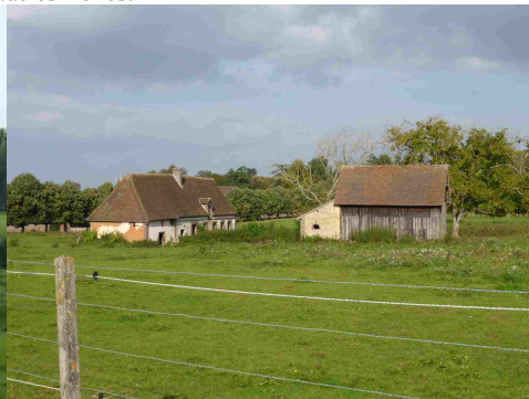
Le paysage rural avoisinant