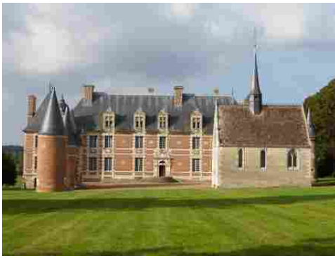
La façade sud du château et la chapelle