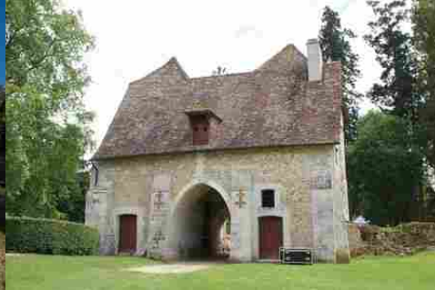
La châtelet d'entrée depuis la basse-cour