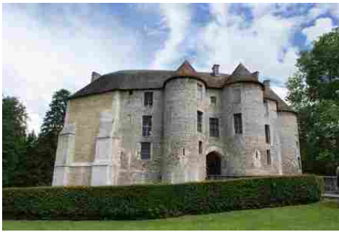
La façade Est du logis