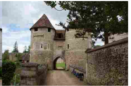
Le châtelet d'entrée de l'extérieur