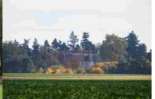
Le château vu de la Croix Poussin

Pour la zone en rose foncé dans le périmètre de 500m