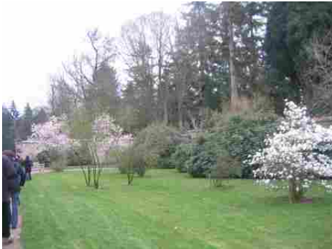
L'arboretum du château

Les avis seront cohérents avec ceux émis ces dernières années, à savoir : pas de maisons à volume compliqué (type V, W, Y, ou Z), pentes à 45° pour les volumes principaux, ardoise ou tuile plate de teinte brun vieilli, à 20u/m 2 , avec un débord de toiture de 20cm, enduit de teinte beige clair avec modénatures (au choix : chaînages, encadrement de fenêtres, soubassement, colombage...). *Voir les autres fiches.