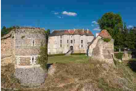
Les vestiges de l'enceinte