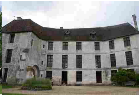
La façade Ouest remaniée fin XVII e