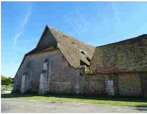
Le pignon nord de la grange