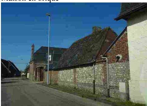
Face au monument