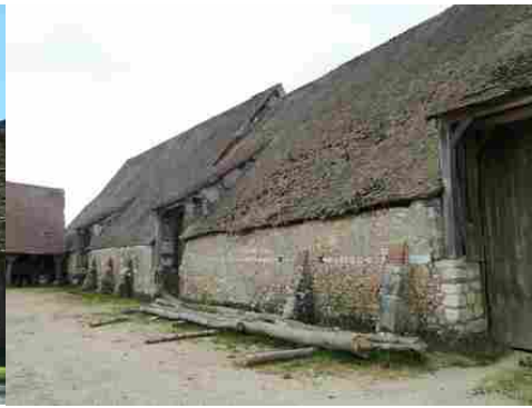
La grange vue de la cour du manoir