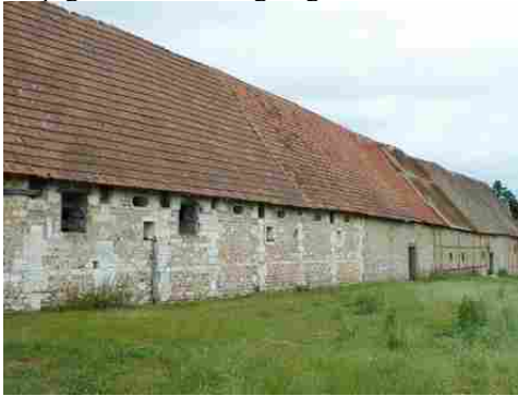
Les anciennes dépendances vues du Sud