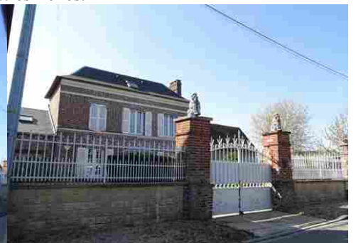
Maison en brique