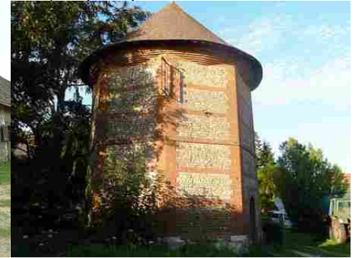
Le colombier octogonal du manoir