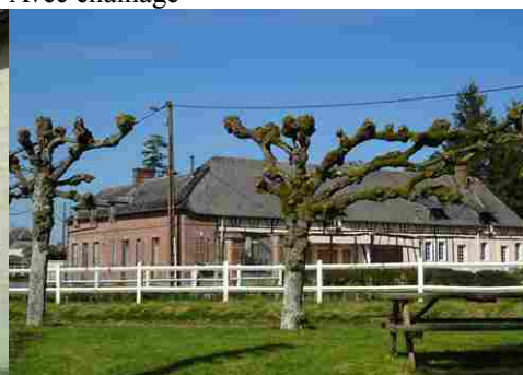
Au niveau de la place