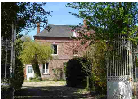
Maison en brique

Les avis seront cohérents avec ceux émis ces derniers années, à savoir : pas de maisons à volume compliqué (type V, W, Y, ou Z), pentes à 45° pour les volumes principaux, ardoise ou tuile plate de teinte brun vieilli, à 20u/m 2 , avec un débord de toiture de 20cm, enduit de teinte beige clair avec modénatures (au choix : chaînages, encadrement de fenêtres, soubassement, colombage...). *Voir les autres fiches.