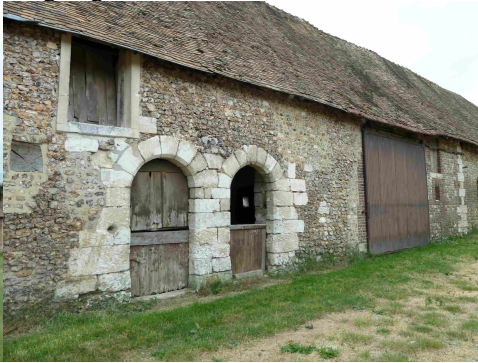
Les dépendances vues de la cour