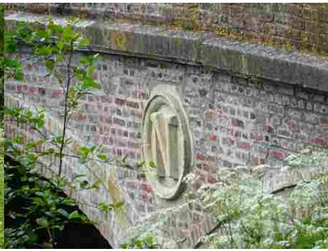
Le N de Napoléon III en médaillon