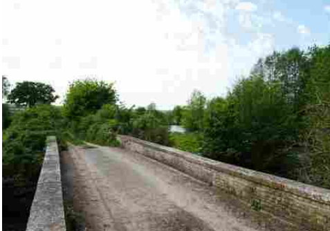
La chaussée et l'environnement du pont