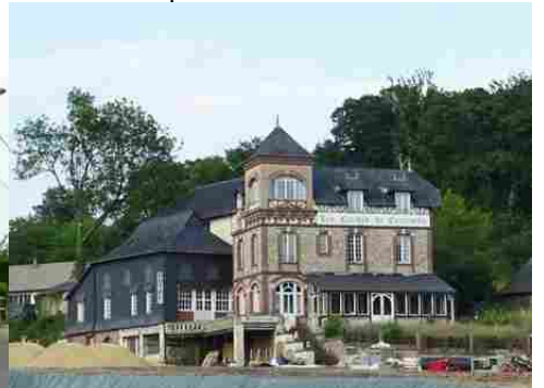
L'auberge des Cloches de Corneville