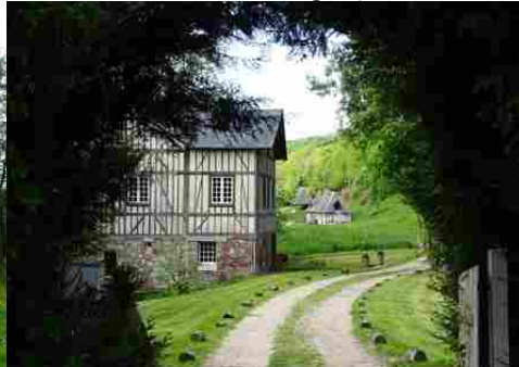
Le bâti voisins, à pans de bois