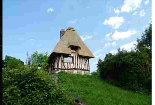
L'association pans de bois / toit en chaume