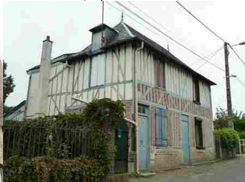
Un autre exemple de maison ancienne