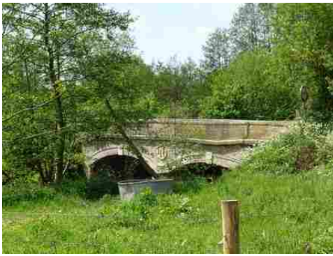
Le Pont Napoléon (vue éloignée)