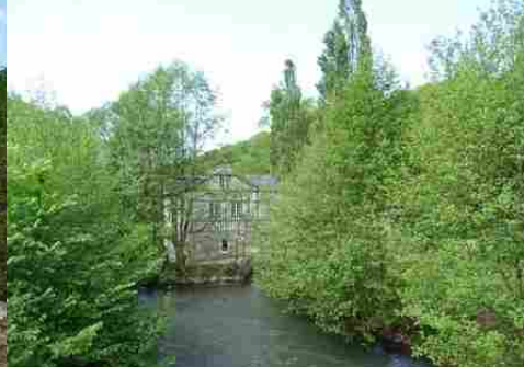
Les vues sur la vallée de la Risle