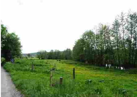
La vallée de la Risle (vue générale)

Les avis seront cohérents avec ceux émis ces dernières années, à savoir : pas de maisons à volume compliqué (type V, W, Y, ou Z), pentes à 45° pour les volumes principaux, ardoise ou tuile plate de teinte brun vieilli, à 20u/m 2 , avec un débord de toiture de 20cm, enduit de teinte beige clair avec modénatures (au choix : chaînages, encadrement de fenêtres, soubassement, colombage...). *Voir les autres fiches.