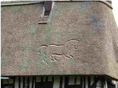
La personnalisation du toit en chaume