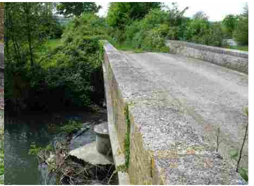
La pile centrale à bec et le parapet