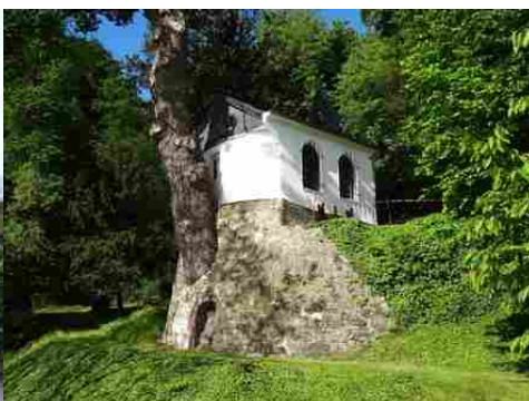
La chapelle de la Ronce