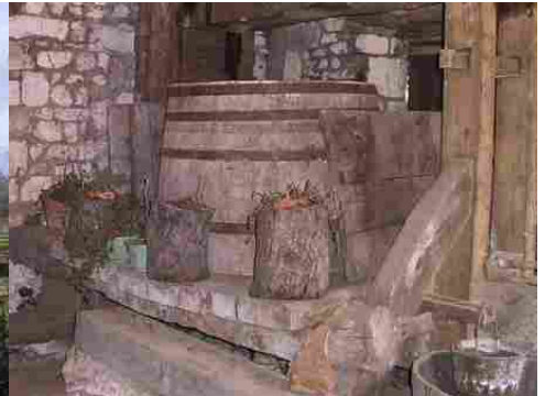
Les communs Le bâtiment des pressoirs Les vestiges des pressoirs

Pour la zone en rose foncé dans le périmètre de 500m