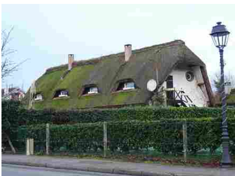
Une toiture en chaume