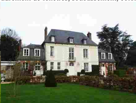
Le manoir du Plouzel du XVII e siècle