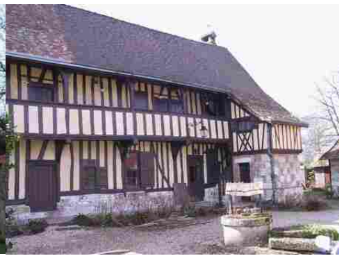
Le logis aligné sur la route (vue proche) Le logis depuis la route (vue éloignée) La façade du logis sur cour