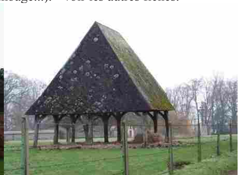
L'architecture rurale aux alentours