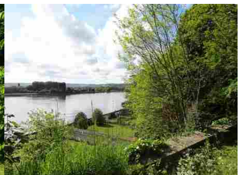
La vallée de la Seine située à proximité