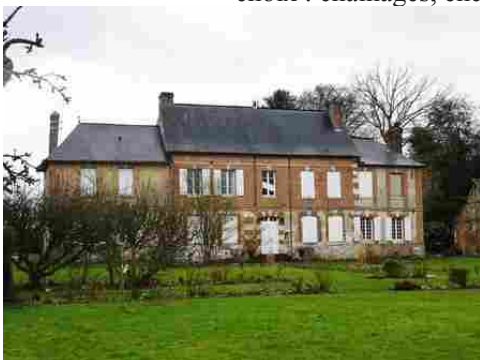
Château à Caumont

Les avis seront cohérents avec ceux émis ces dernières années, à savoir : pas de maisons à volume compliqué (type V, W, Y, ou Z), pentes à 45° pour les volumes principaux, ardoise ou tuile plate de teinte brun vieilli, à 20u/m², avec un débord de toiture de 20cm, enduit de teinte beige clair avec modénatures (au choix : chaînages, encadrement de fenêtres, soubassement, colombage...). *Voir les autres fiches.