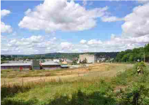
Une vue générale de Beaumont-le-Roger

Les avis seront cohérents avec ceux émis ces dernières années, à savoir : pas de maisons à volume compliqué (type V, W, Y, ou Z), Rez-de-chaussée + Combles, pentes à 45° pour les volumes principaux, ardoise ou tuile plate de teinte brun vieilli, à 20u/m 2 , avec un débord de toiture de 20cm, enduit de teinte beige clair avec modénatures (au choix : chaînages, encadrement de fenêtres, soubassement, colombage...). *Voir autres fiches.