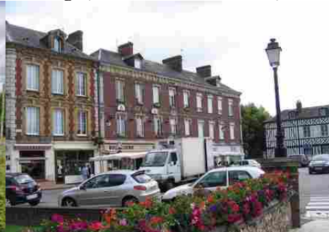
Quelques maisons en centre-ville