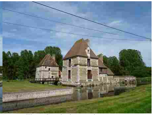
Les pavillons d'angle du manoir