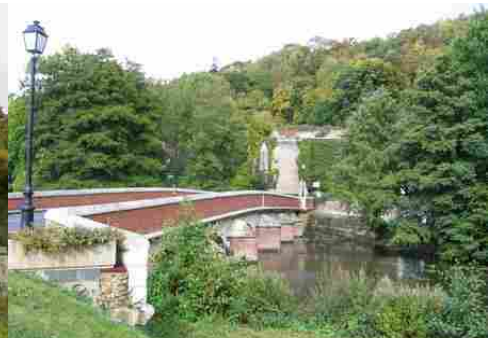
Un pont sur la Risle