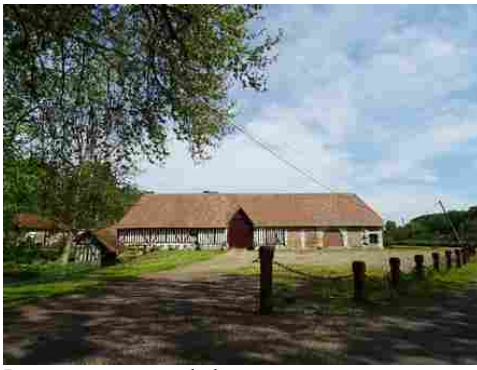
Les communs vus de la route