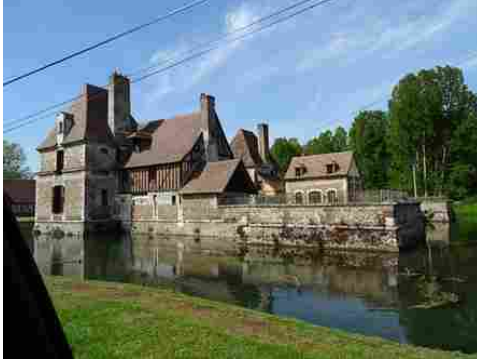
Les vestiges de l'aile Sud