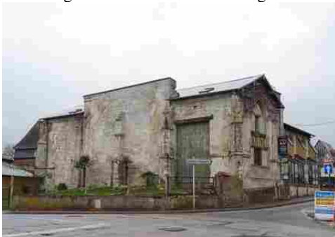
Une ancienne église transformée