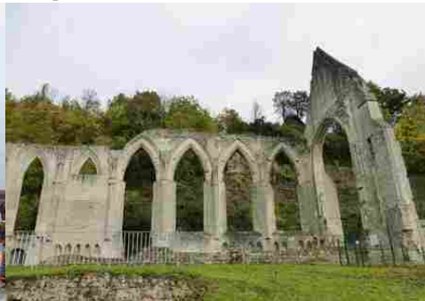
Les vestiges du prieuré de Beaumont