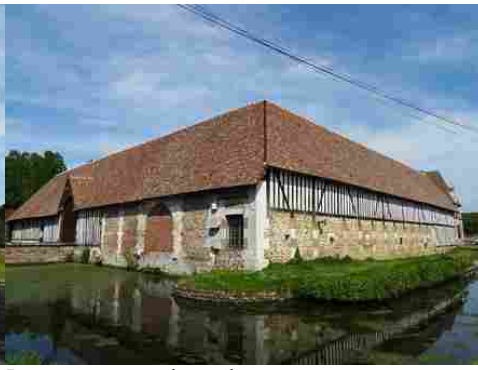
Les communs et leurs douves