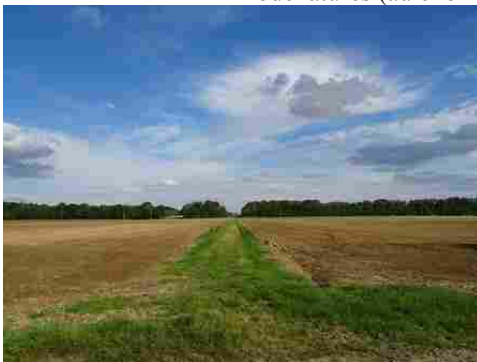
La perspective est, avec champs et bois

Les avis seront cohérents avec ceux émis ces derniers années, à savoir : pas de maisons à volume compliqué (type V, W, Y, ou Z), Rez-de-chaussée + Combles, pentes à 45° pour les volumes principaux, ardoise ou tuile plate de teinte brun vieilli, à 20u/m 2 , avec un débord de toiture de 20cm, enduit de teinte beige clair avec modénatures (au choix : chaînages, encadrement de fenêtres, soubassement, colombage...). *Voir autres fiches.