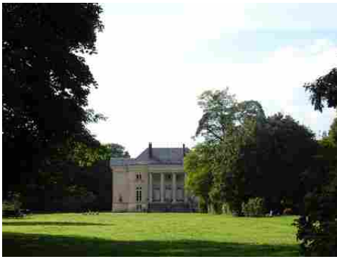
La façade est du château