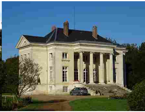
La façade est (vue rapprochée)