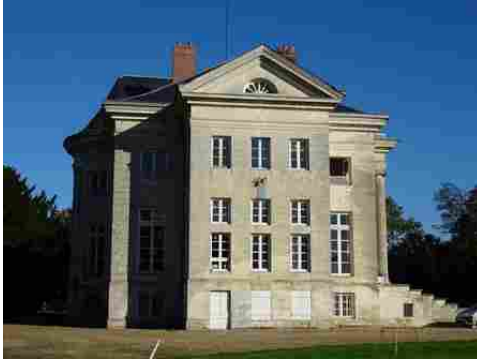
La façade sud