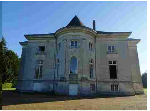
La façade ouest du château