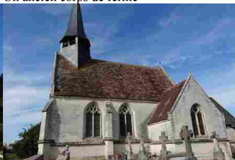
L'église de Barquet