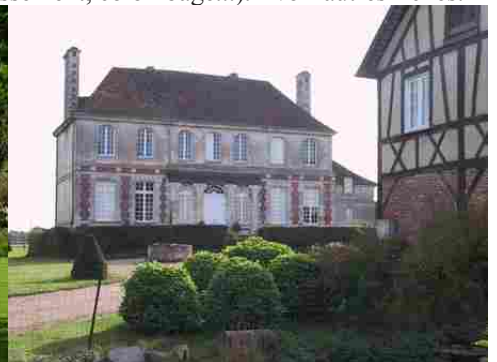
Une grande demeure rurale