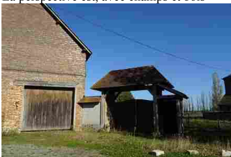
L'entrée d'une ferme