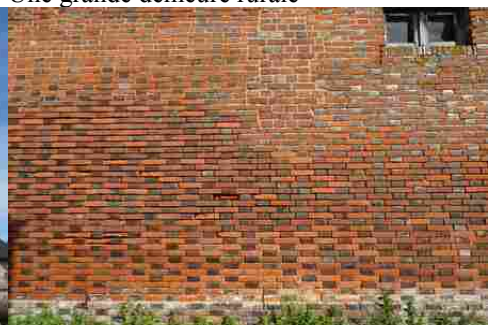
Un mur en briques polychromes (détail)