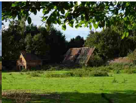
Un ancien corps de ferme