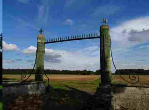
La portail à faisceaux et francisques

Pour la zone en rose foncé dans le périmètre de 500m